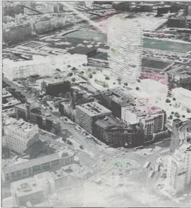
Proyección del Residencial Metropolitan, de la inmobiliaria Ibsa.

tro de Madrid (que depende del Gobierno regional, del PP) de este "incumplimiento", por su "negativa a modificar la rasante de las cocheras argumentando que se imposibilitaría el acceso a las mismas por el túnel actual".