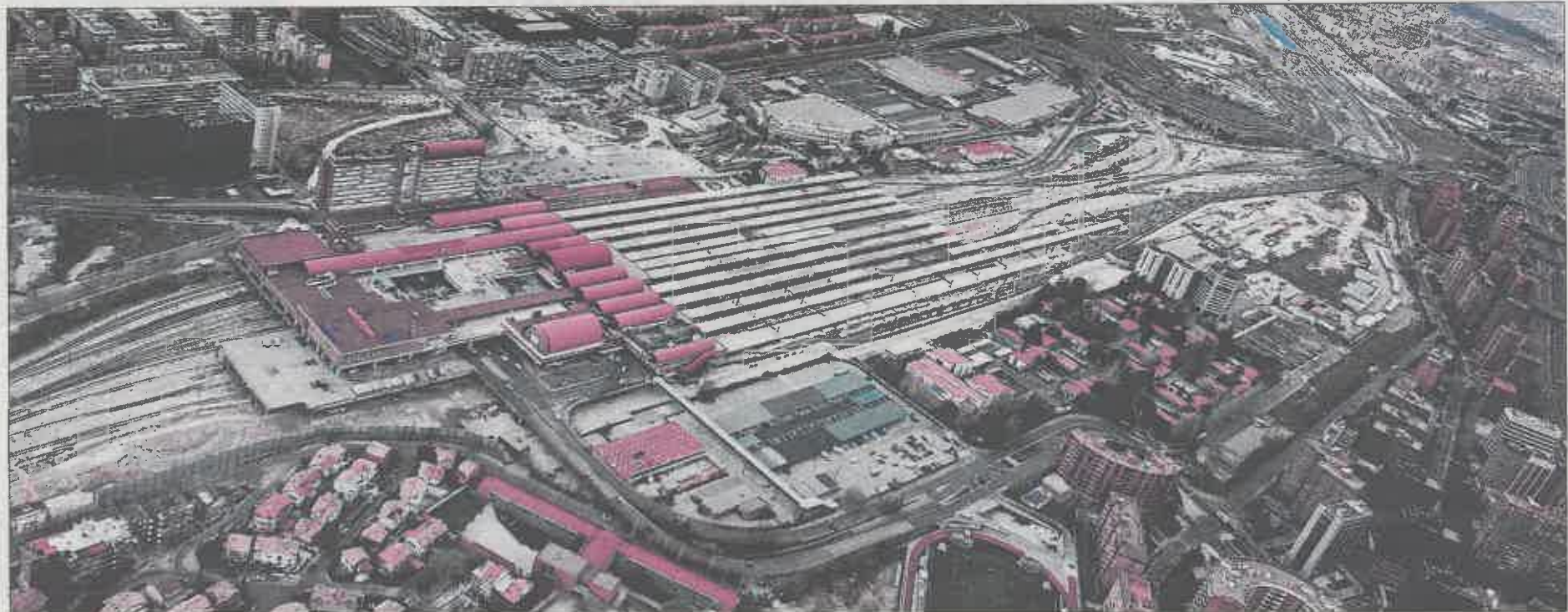
Vista aérea de la estación de Chamartín y de las vías incluidas en el plan desestimado.

» CONDUCTORES PARA LA EMT La Empresa Municipal de Transportes (EMT) contratará hasta agosto a 301 conductores, aunque algunos de los contratos serán eventuales debido a las limitaciones estatales.