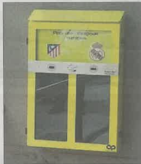
Primer cenicero con «urna de votación» en Madrid.