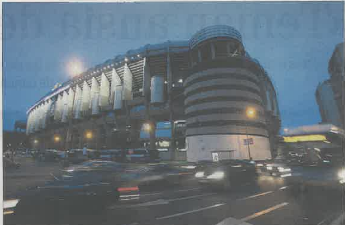
Fachada principal del estadio Bernabéu, en el madrileño distrito de Chamartín.

Más avanzadas aún están las conversaciones con el Atlético de Madrid, que, según confirman en el Ayuntamiento, culminarán en un nuevo proyecto de forma «inminente». La peculiaridad de esta operación es que en paralelo a un nuevo boceto del proyecto residen-