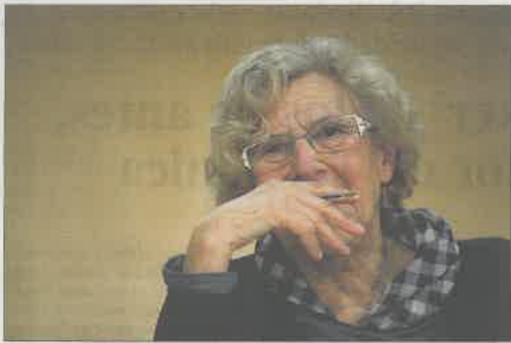
Manuela Carmena, alcaldesa de Madrid.