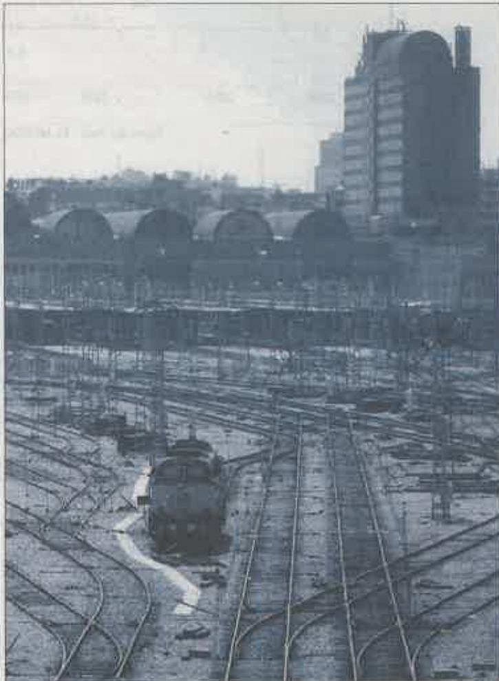
Terranos pertenecientes a Fomento que serían afectados por la operación. J. A.

Por este motivo, el Gobierno considera que los acuerdos y convenios firmados con anterioridad a la llegada de Manuela Carmena a la alcaldía están por encima de las