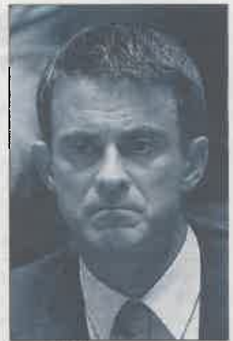
Manuel Valls.

La empresa más beneficiada directamente por la aprobación definitiva del plan previo a la negativa del ayuntamiento regido por Manuela Carmena sería Adif, que ingresaría alrededor de 1.000 millones de euros. Adif, gestora de la infraestructura ferroviaria es la empresa pública más endeudada del Estado, con cerca de 20.000 millones de euros de pasivo debido a las inversiones en el AVE. El proyecto implica además, como promotores, a BBVA y la constructora San José, socios en Madrid Distrito Norte.