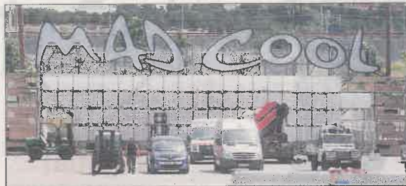
Carteles luminosos del festival que se celebrará del 16 al 18 de junio.

Este periódico se puso ayer en contacto con el Ayuntamiento de Madrid para conocer su actuación con respecto a ese informe, pero a la hora de cierre de esta edición no había contestado.