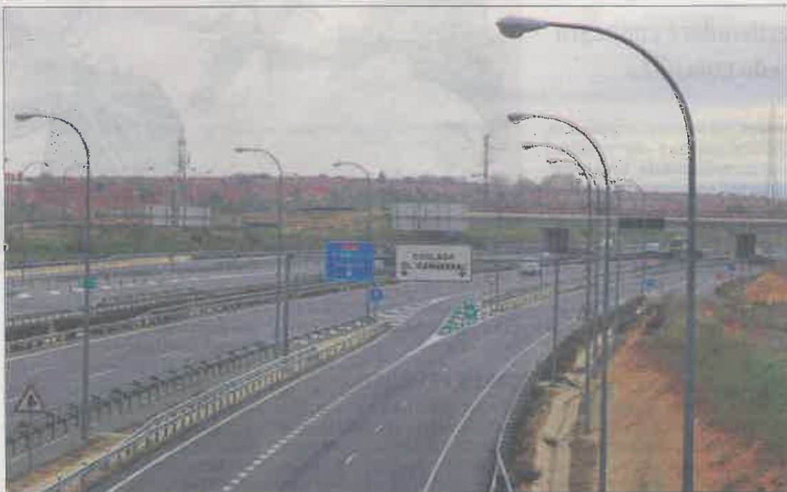
Acceso a la carretera M-45 a la altura de Coslada. PACO TOLEDO

El método en sí consiste en que la Administración adjudica a los privados la ejecución de una infraestructura y luego se le compensa mediante un canon fijo o una cifra que se estime por el uso que se dé por los usuarios. Esperanza Aguirre utilizó un método similar para construir los seis hospitales de su mandato.