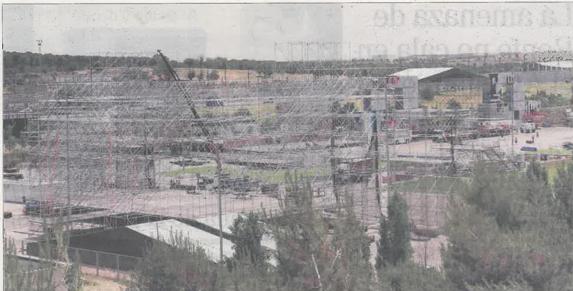
Montaje del escenario principal del festival en la zona de la Caja Mágica.