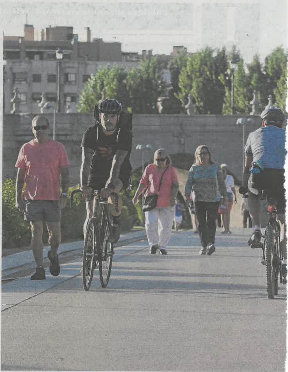
Peatones y ciclistas comparten el espacio de parque de Madrid Río