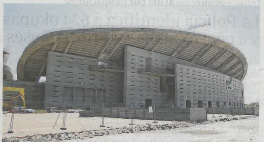
El exterior del estadio de la Peineta, aún sin urbanizar JOSÉ RAMÓN LADRA