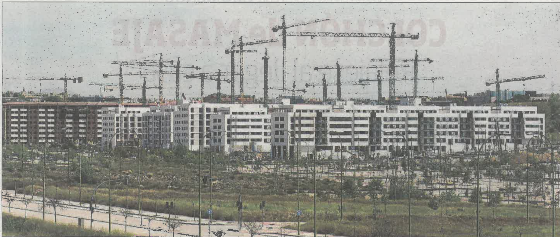
Vista general del PAU de Arroyo del Fresno, durante su construcción el año pasado.