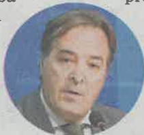
J. GLEZ. TABOADA

Por otro lado, se propone que la prescripción de los delitos urbanísticos se produzca a los ocho años, el doble de lo que ahora se limita. Y se induce a que el infractor cargue con el coste de los trabajos para volver a la situación de legalidad urbanística.