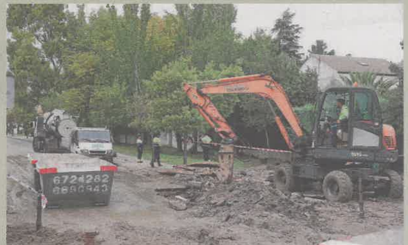
Una grúa trata de atajar la avería, ayer, en Rivas