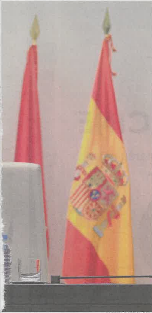
JOSE RAMON LADRA

El origen de la avería fue en el Parque Lineal de Rivas y afectó especialmente a las calles de los Pirineos, de Zamora, Boros y Valle Nalón. Se abasteció a la población de botellas y garrafas de agua en tres puntos de reparto en la localidad.