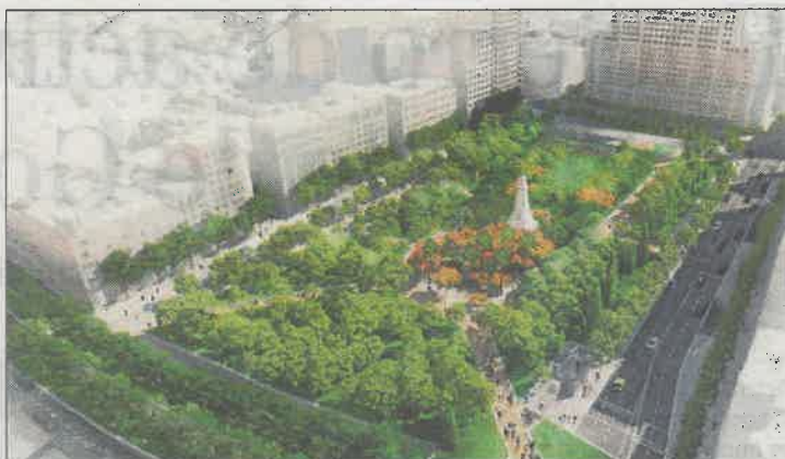
'Pradera Urbana' (903 votos). Se incrementa la superficie verde hasta los 28.470 m 2 con una inversión de alrededor de 14 millones de euros.

En todos los casos los proyectos cumplen con las condiciones de proponer un lugar más diáfano y abierto, con menos aparcamientos en superficie y más espacios de sombra y recreativos. Además, se parte de la premisa de que el monumento dedicado a Cervantes no podrá desplazarse de su ubicación actual en el centro de la plaza.