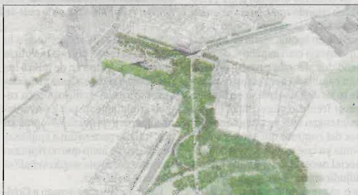
'De este a oeste' (297 votos). Se crearía un itinerario peatonal entre la Gran Vía, el Templo de Debod y la plaza de Oriente y se plantarían nuevas especies.