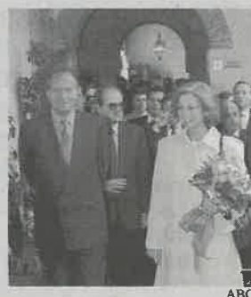
Don Juan Carlos y Doña Sofía en la inauguración

alcanza los 400 metros de profundidad. Sus dos líneas de 22 pulgadas de diámetro discurren en un 60% bajo aguas marroquíes y en un 40% españolas.