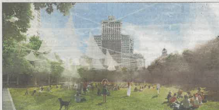
'Mi rincón favorito de Madrid' (103 votos). A la creación de un salón urbano tras mover la fuente se sumaría la eliminación del aparcamiento en superficie.