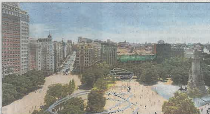
'Welcome mother Nature, good bye Mr Ford' (401 votos). La mitad de la plaza quedaría despejada para actividades cívicas y la otra llena de vegetación.