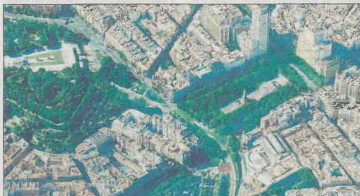
'Un paseo por la cornisa' (170 votos). Se prolongaría el túnel de Bailén desde el Palacio Real hasta la calle Ferraz y se crearía una plaza-parque polivalente.