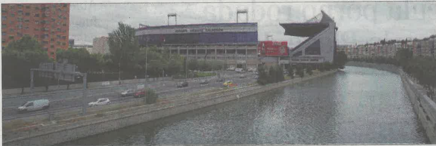
Tramo de la M-30 a su paso por el estadio Vicente Calderón, en una imagen de archivo.