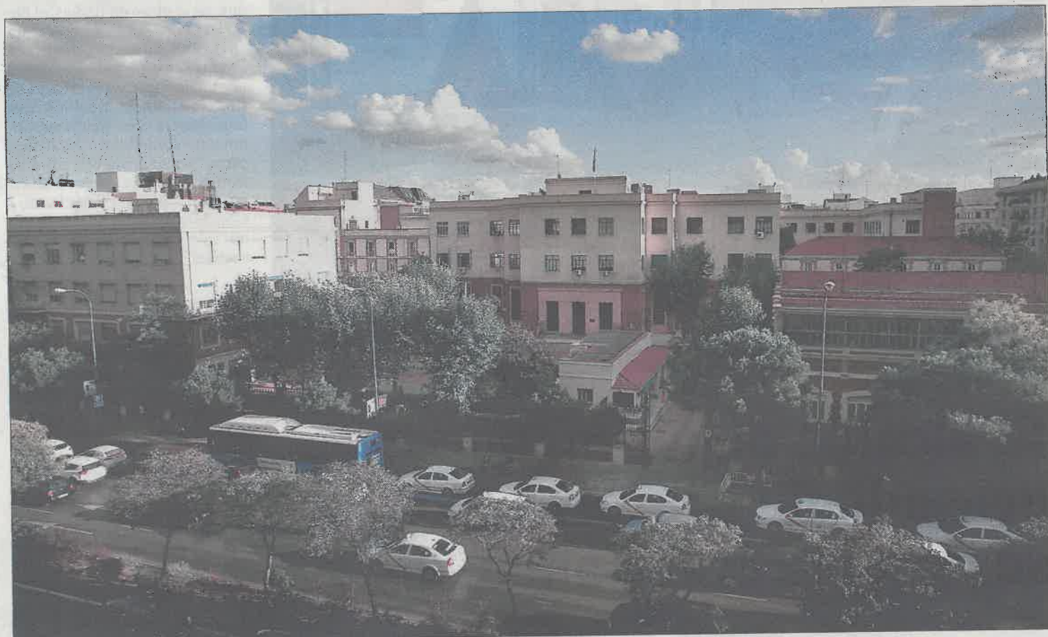
El Taller de Precisión de Artillería, visto desde la calle de Raimundo Fernández Villaverde.

Dos personas de origen chino detenidas y más de 27.000 prendas y productos falsificados decomisados es el resultado de una operación policial desarrollada en tres naves industriales de Fuenlabrada.