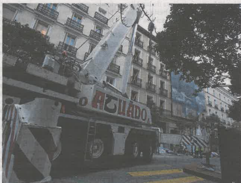
Desmontaje del edificio, ayer, en la calle de Lagasca, 46