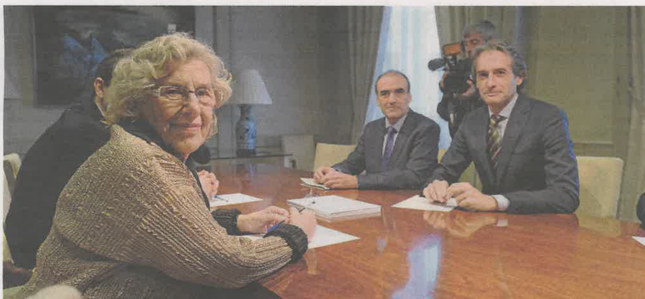
Manuela Carmena e Íñigo Gómez de la Serna, ayer, en su reunión en el Ministerio de Fomento