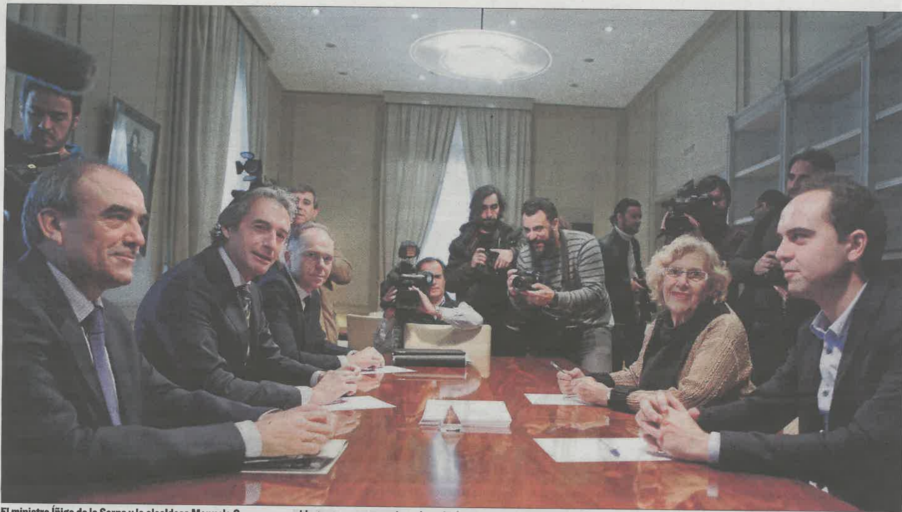
El ministro Íñigo de la Serna y la alcaldesa Manuela Carmena, reunidos ayer con sus equipos de trabajo en el Ministerio de Fomento.