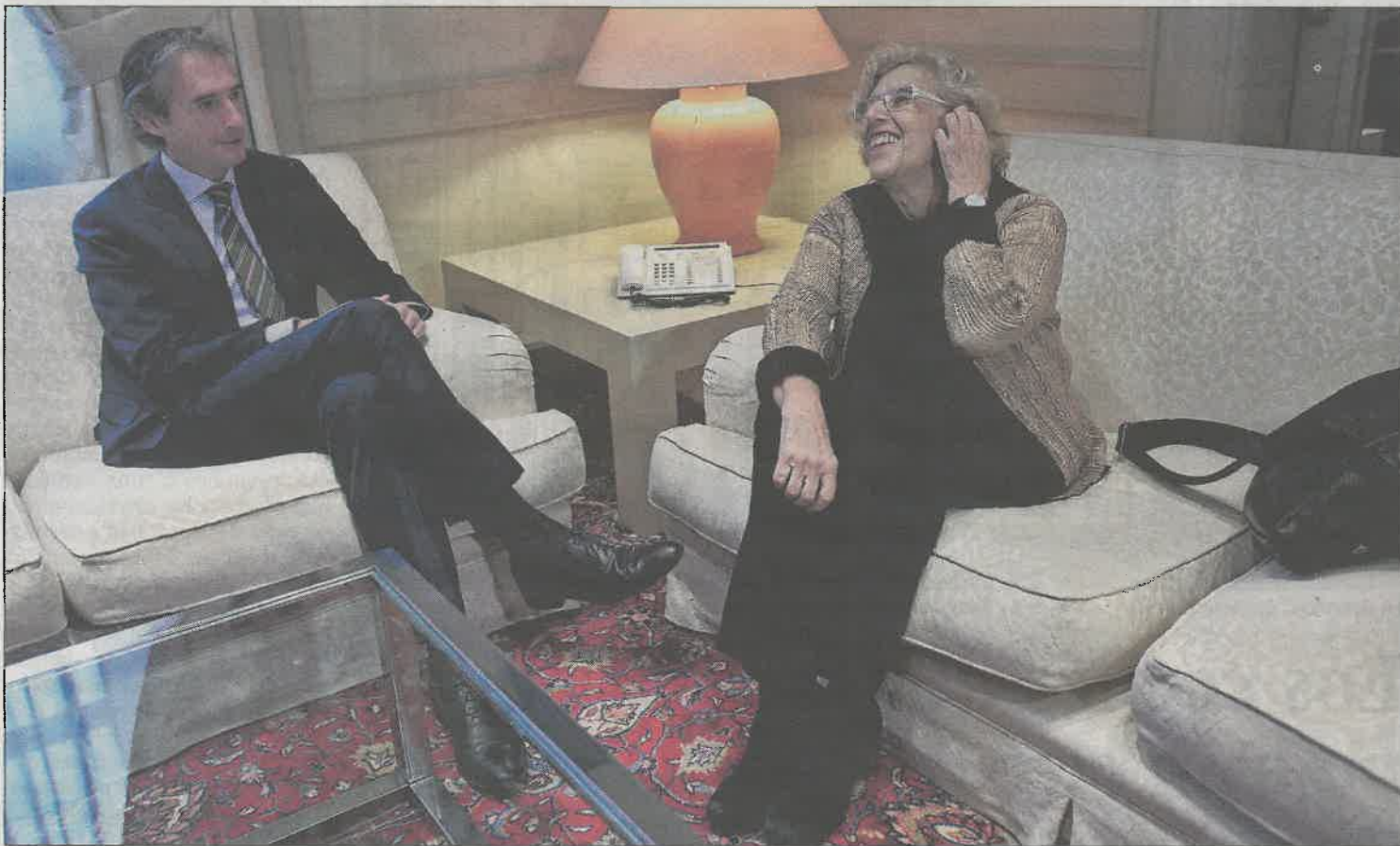
El ministro de Fomento, Íñigo de la Serna, y la alcaldesa de Madrid, Manuela Carmena, durante la reunión que mantuvieron ayer.

La Policía Nacional detuvo ayer a un joven de 18 años como presunto autor de la muerte de otro durante una pelea entre miembros de la banda latina Dominicana Don't Play el lunes en Alcobendas.