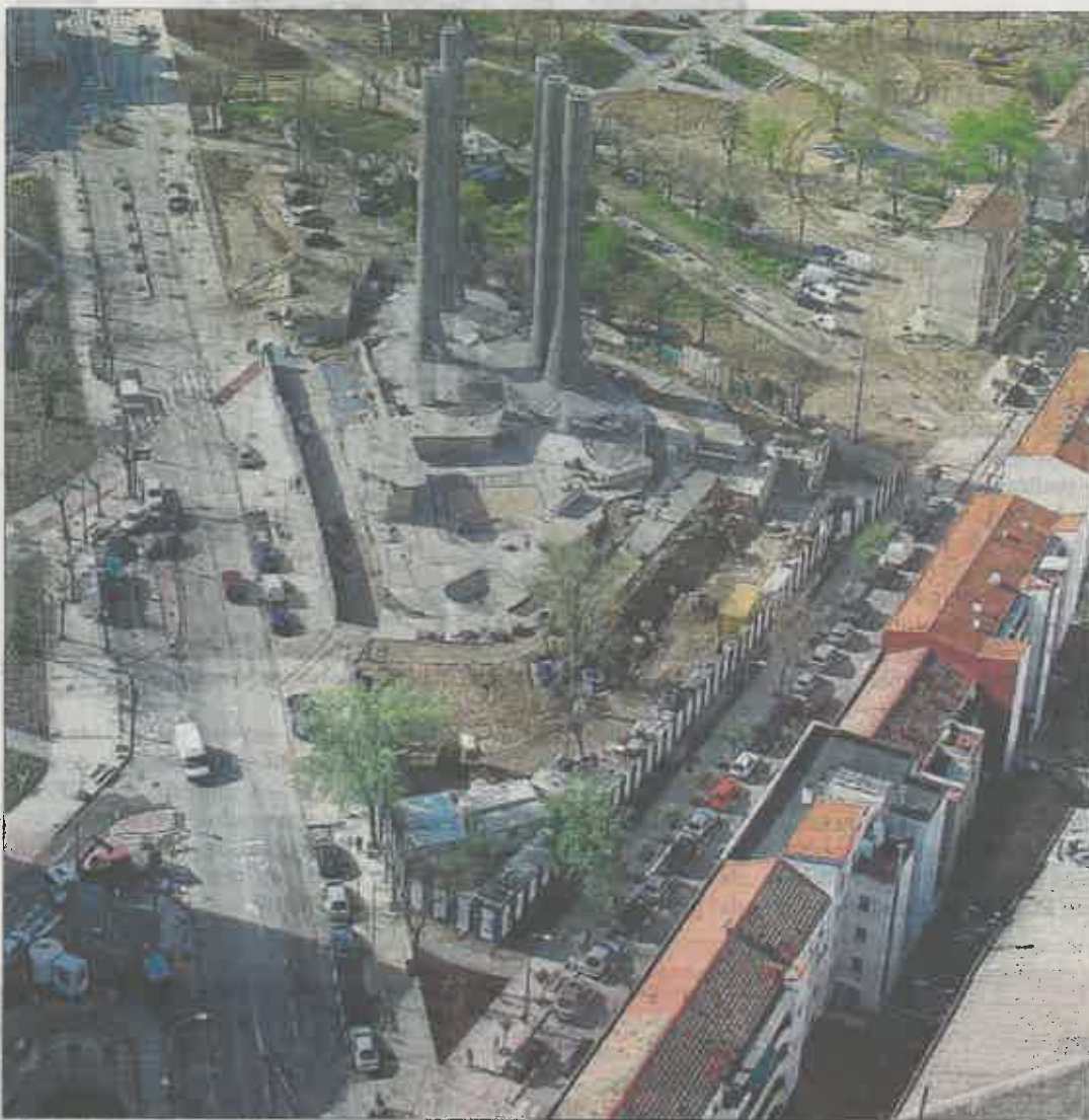
Solar en el que se construirán las nuevas viviendas junto a las torres de la central termoeléctrica.

Tras el fiasco del desarrollo y el sonoro estallido de la burbuja in-