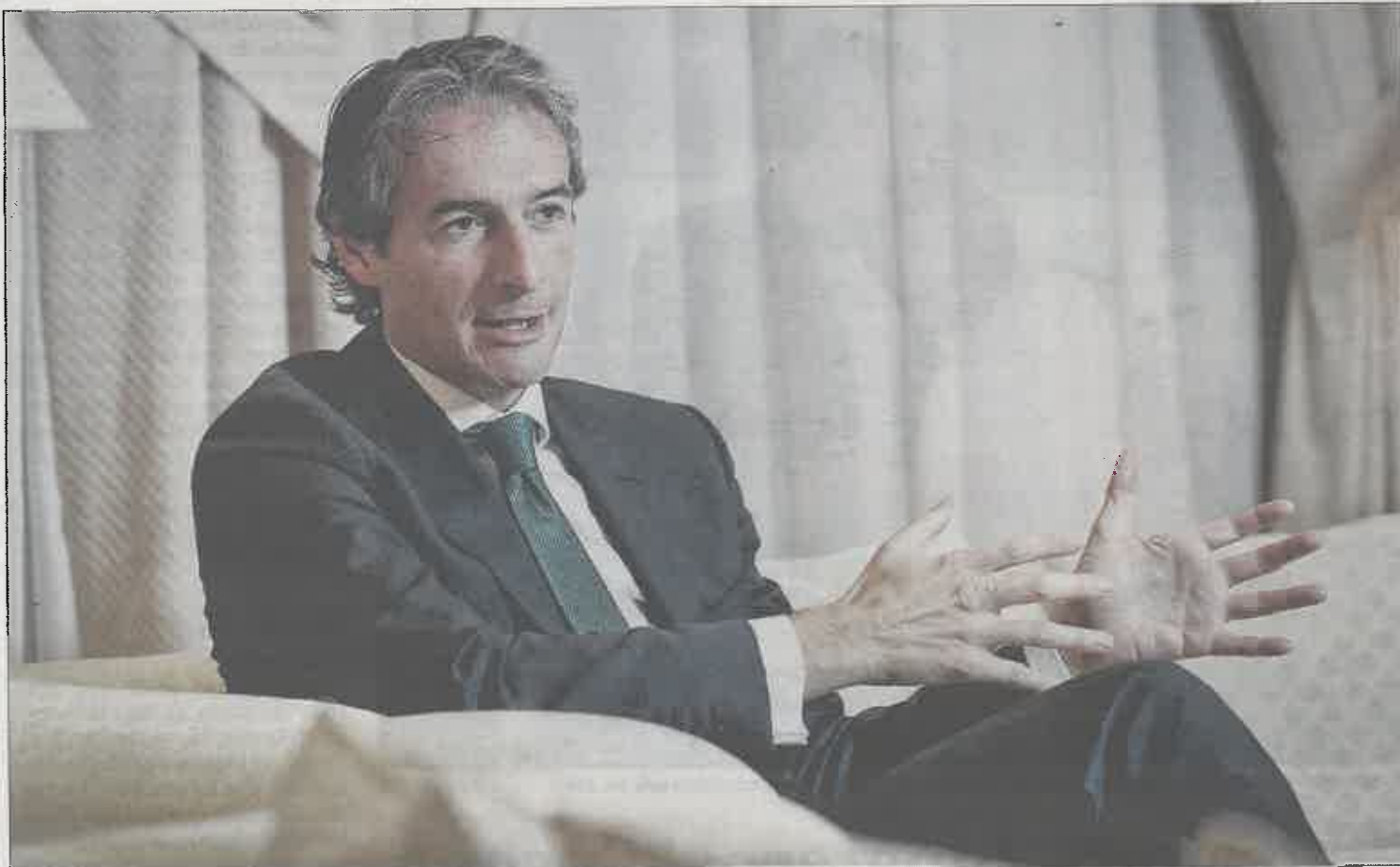
El ministro de Fomento, Íñigo de la Serna, durante la entrevista en su despacho.