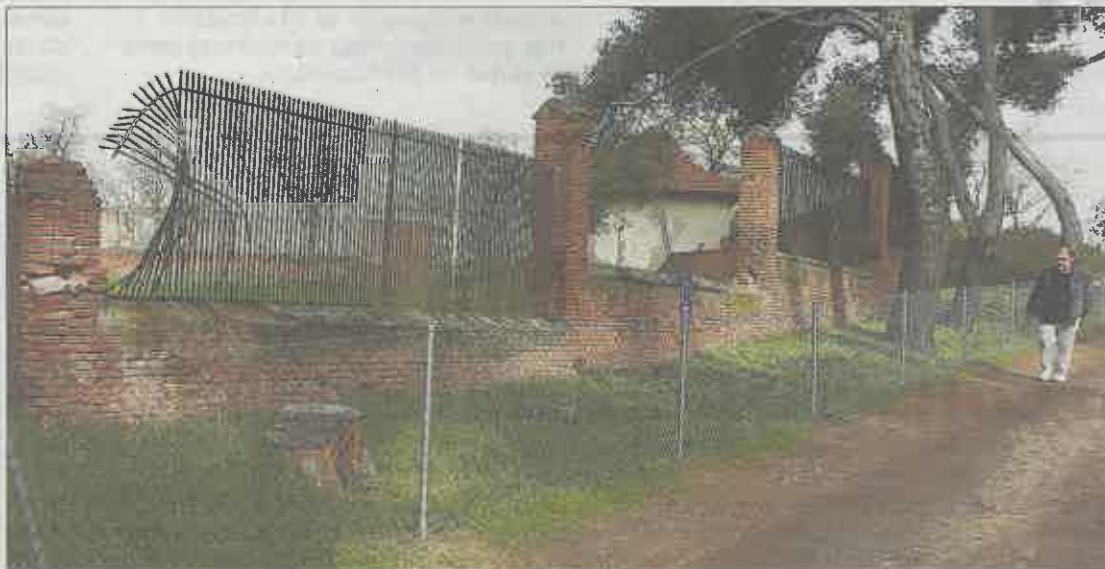
Desperfectos en las verjas de la Quinta de Torre Arias.