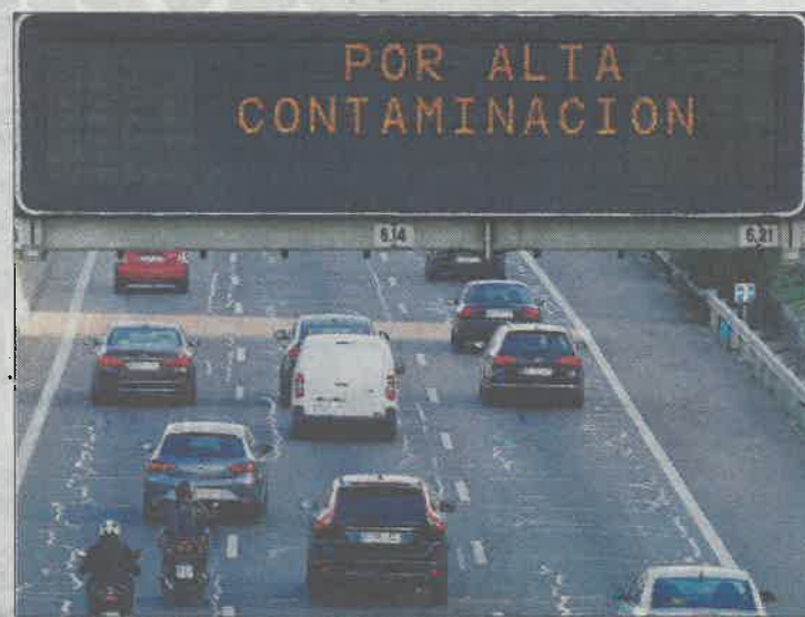
Luminoso en la M-30 alertando de la alta contaminación en Madrid.

Si llegara a activarse esta medida de restricción al tráfico, que no afecta a los residentes con tarjeta acreditativa si estacionan en sus barrios ni a otras excepciones, el Área de Medio Ambiente lo comunicará antes del mediodía de hoy. Tras los problemas generados por los picos de polución alcanzados durante el Puente de los Santos, el Gobierno de Manuela Carmena decidió anticipar el anuncio del paso al escenario 2 para que los conductores puedan «planificar su movilidad».