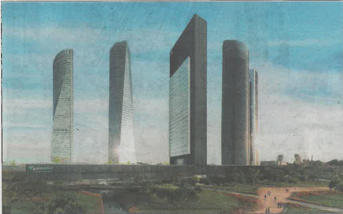
Recreación de cómo será el 'skyline' madrileño cuando se incorpore la Quinta Torre. E. M.

El nuevo inquilino del norte de la ciudad, bautizado como Caleido , tendrá una altura de 181 metros —ligeramente inferior a la de sus espigados vecinos— y dos volúmenes diferenciados que le darán aspecto de T invertida: una torre y un zócalo de cuatro pisos rematado por una cubierta ajardinada. Las obras comenzarán bajo las directrices del estudio Fenwick Iribarren y Serrano Suñer Arquitectura en el mes de marzo y supondrán la creación de 1.559 empleos durante el tiempo que duren los trabajos, a los que