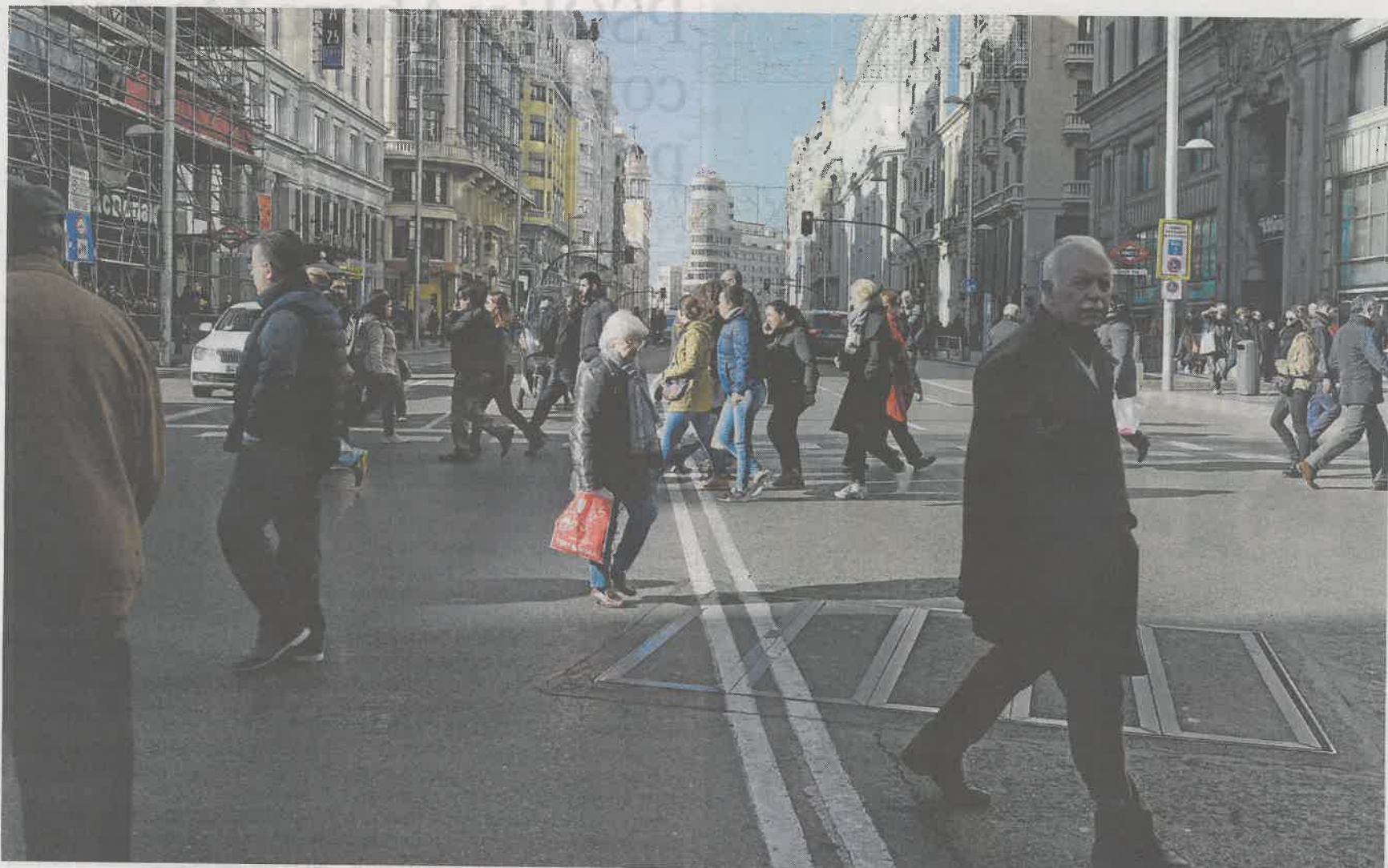
Varias personas cruzan, ayer, la Gran Vía, que ha vuelto a abrir al tráfico de vehículos privados