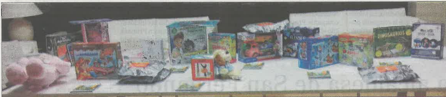
Regalos para los niños 'olvidados' por los Reyes Magos que recibieron posteriormente sus juguetes en el Ayuntamiento de Madrid.

Por su parte, la portavoz del PP en el Ayuntamiento, Esperanza Aguirre, propuso ayer al Gobierno municipal que estudie «la viabilidad de un túnel» bajo la Gran Vía como alternativa a su cierre parcial. Esta infraestructura subterránea tendría salidas a la calle Bailén, Princesa y la Cuesta de San Vicente y sería «parecido» a los que un Gobierno de su partido construyó en O'Donnell y María de Molina.