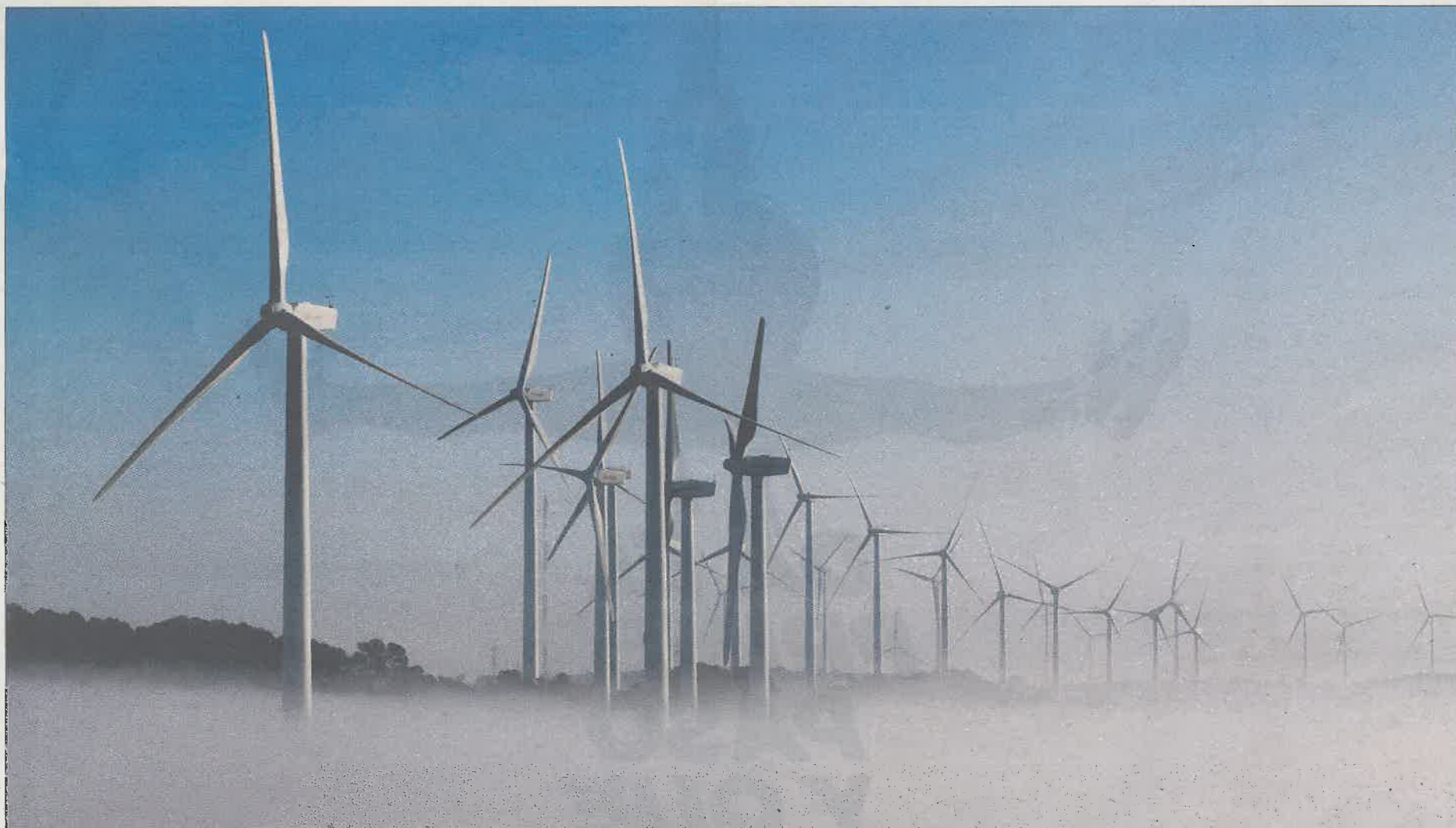
Vista general del parque eólico La Serra del Tallat en la provincia de Lleida.

El país quedó al margen del auge mundial de las energías limpias. Tras el parón de 2012 y obligado por los compromisos europeos, el Gobierno se abre de nuevo al sector