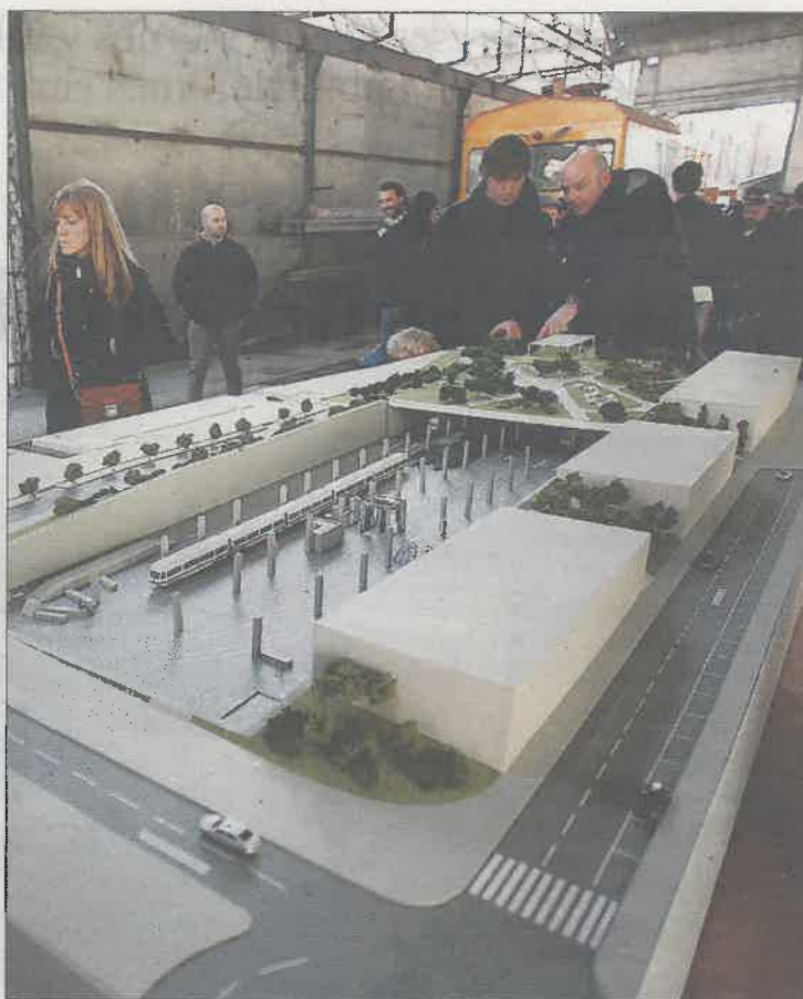
Maqueta del proyecto de viviendas en las cocheras de Metro.

Metro considera, además, que a lo largo de las negociaciones "es evidente" que se ha producido "un cambio de criterio injustificable", puesto que el proyecto fue validado por el Ayuntamiento con la aprobación inicial y provisional para emprender la modificación del PGOU. "De hecho", añade la misiva, ese consentimiento prime-