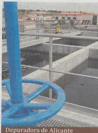
Depuradora de Alicante

En la actualidad, España ocupa el puesto número 26 de entre los 28 miembros de la Unión Europea en