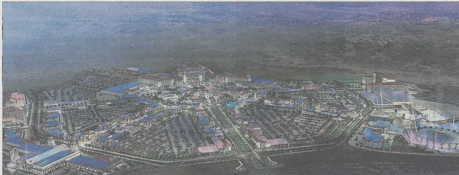
Recreación del macrocomplejo de 134 hectáreas que el grupo estadounidense Cordish quiere construir cerca de Madrid.

El patrimonio total gestionado por los planes de pensiones se situó en los 69.776 millones de euros al cierre del mes de febrero pasado, tras sumar 592 millones en ese mes. CaixaBank es el líder en patrimonio gestionado.