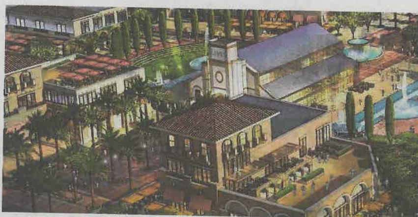
El ala central, con el hotel de 500 habitaciones y un detalle de las zonas de esparcimiento

Y este es uno de los aspectos de los que adolece el Live! Resorts de Torres de la Alameda, según el veredicto regional: las infraestructuras culturales y deportivas permanentes no se reflejan en el área central del complejo. Concretamente, condiciona su construcción a la evolución del número de visitantes que tuviera, en una primera fase, el resto de espacios previstos: un hotel de 500 habitaciones; las zonas comerciales; restaurantes, cafete-