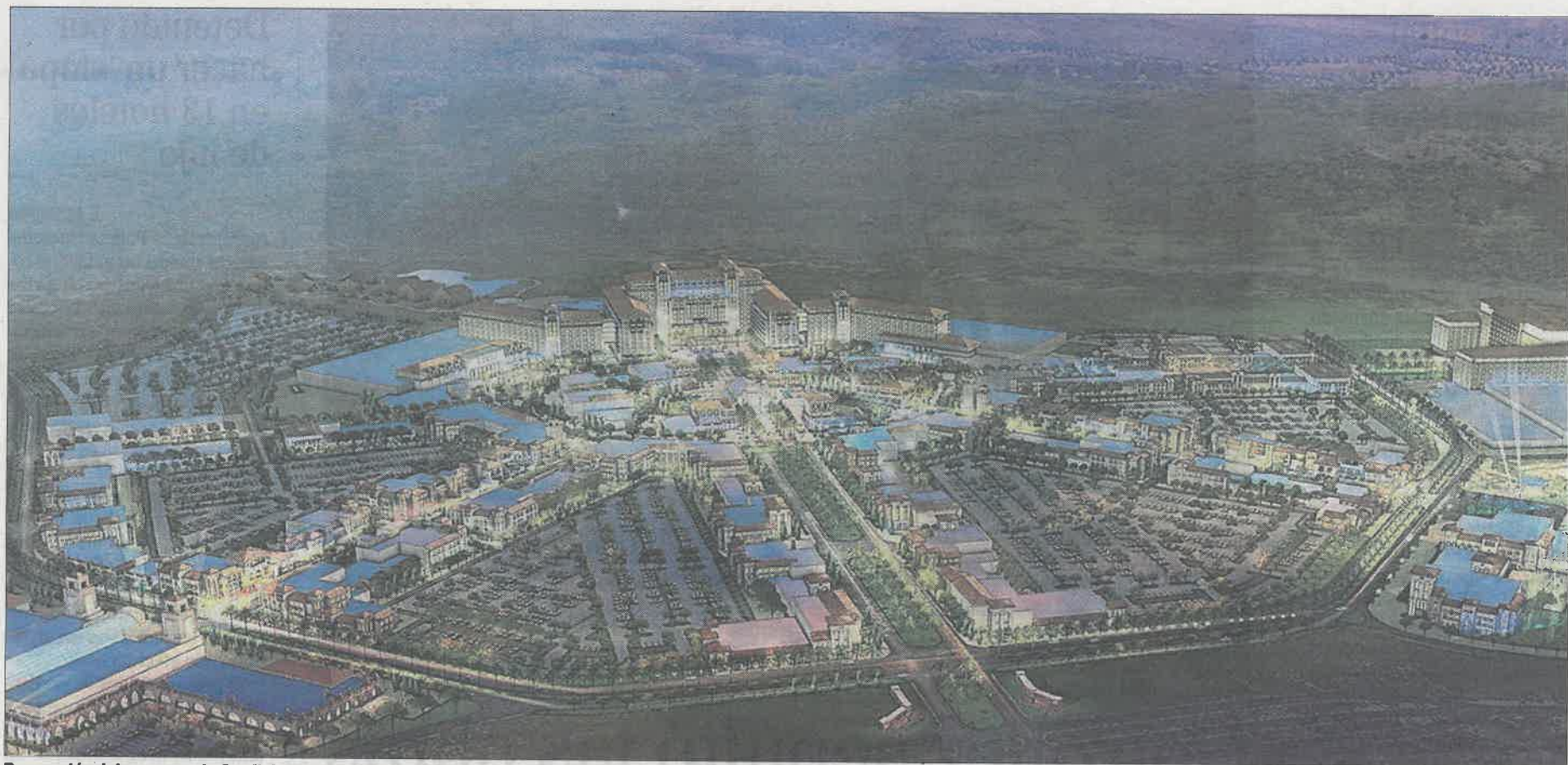
Recreación del proyecto de Cordish para construir un macrocomplejo hotelero y de ocio en el municipio de Torres de la Alameda. E. M.