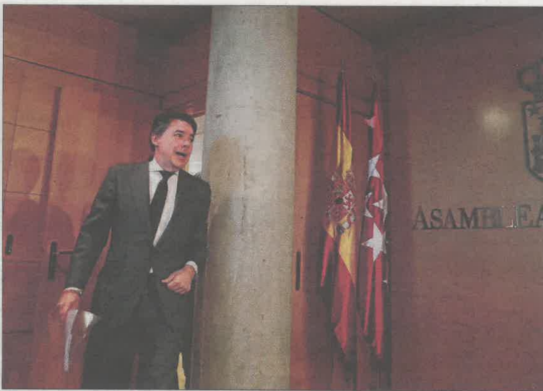
Ignacio González, tras comparecer en la comisión de investigación de corrupción de la Asamblea, hace dos semanas.

El consejero afirmó que sale del Parlamento «con un bochorno tremendo que puede costarle al Gobierno más de 400.000 euros» y remarcó que, «desde luego, el consejero de Sanidad tiene otras prioridades en este momento».