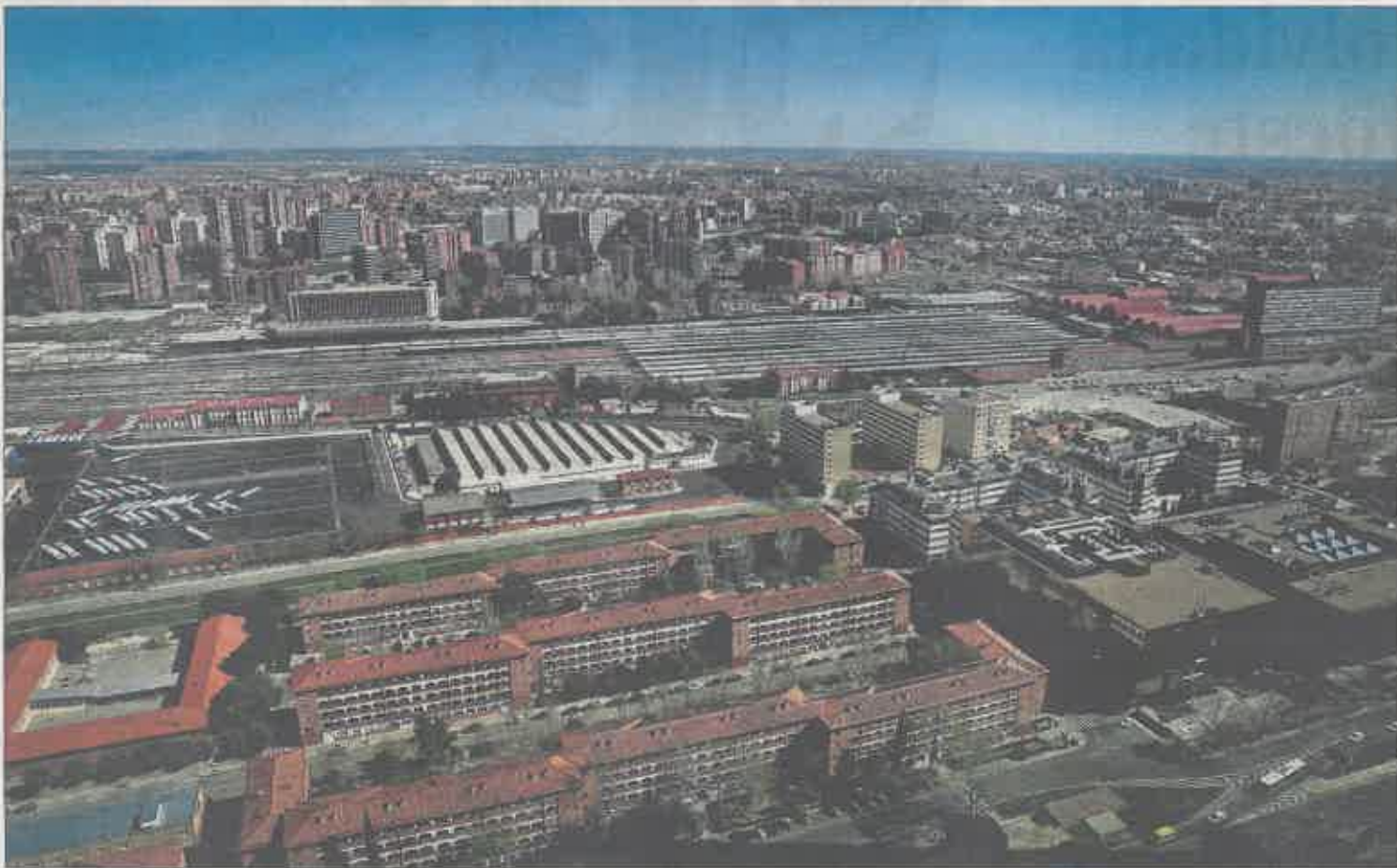
Terrenos de la Operación Chamartín, fotografiados desde la Torre Cristal, situada en el paseo de la Castellana.

» EL CALOR APRETARÁ MÁS QUE AYER El domingo se presenta en toda la Comunidad de nuevo con alerta amarilla por calor, con temperaturas aún más altas que las de ayer y que rondarán los 38 grados en el área metropolitana.