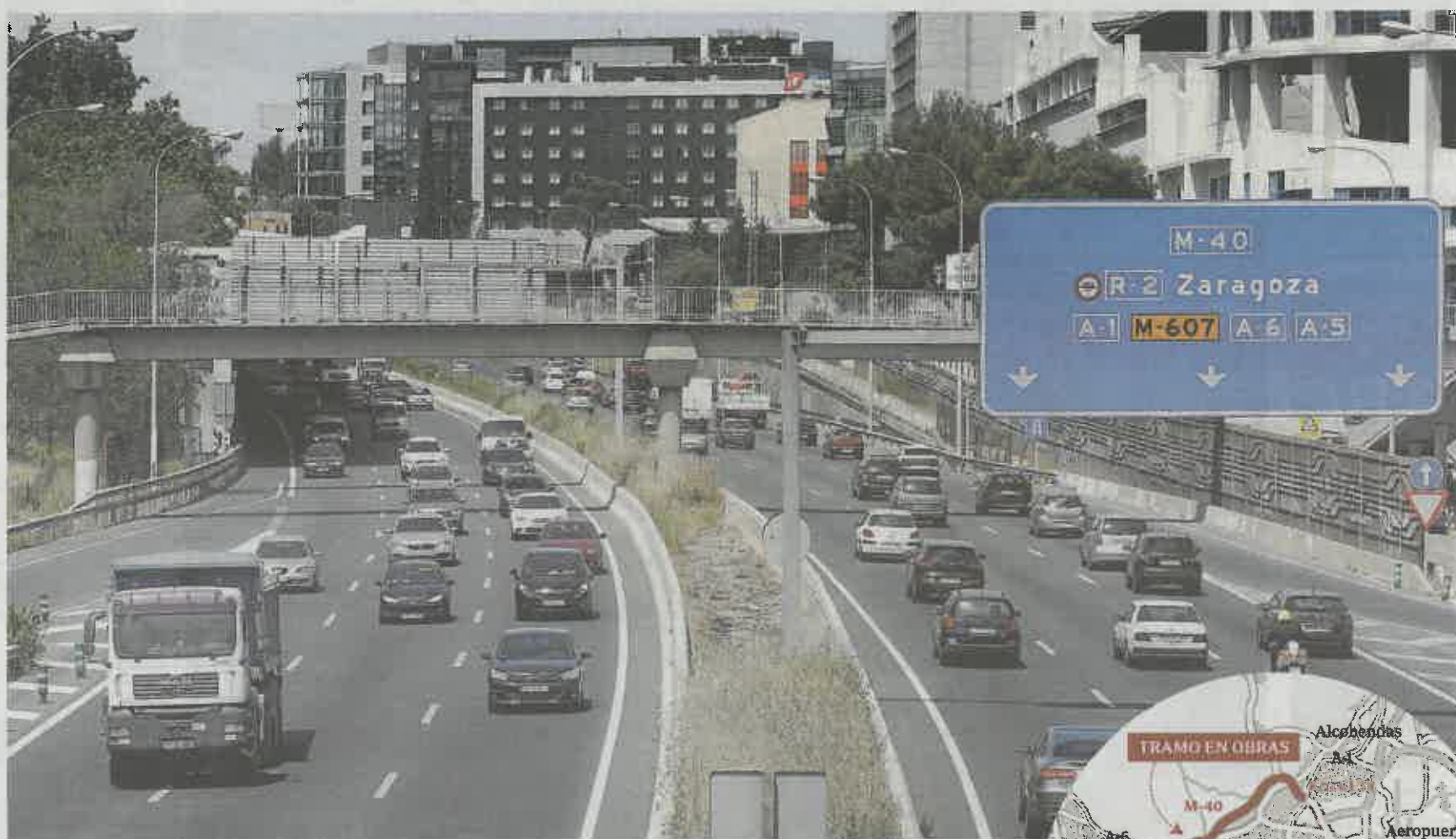
La M-40 es una de las autovías más transitadas de la red madrileña