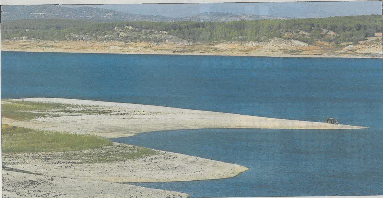
Situación que presentaba ayer el pantano de Buendía (Guadalajara), al 10,8% de su capacidad.