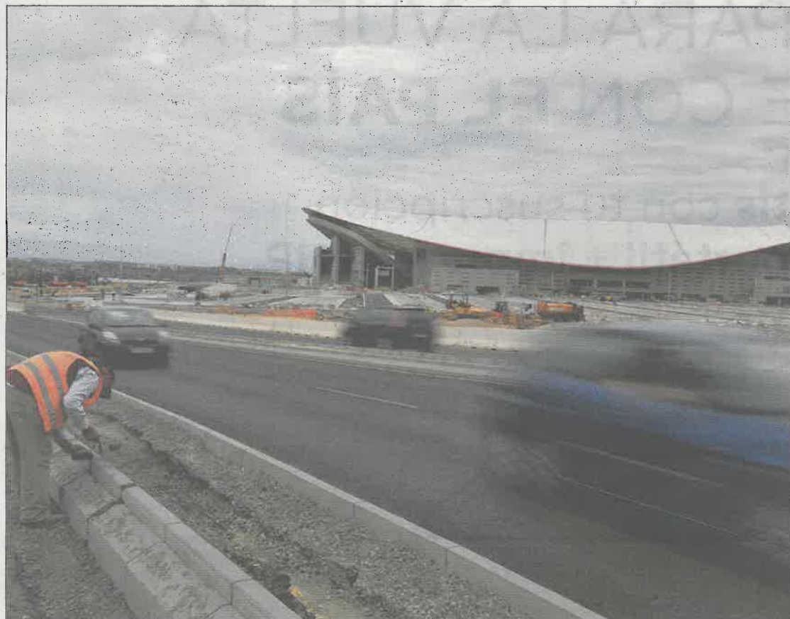
Obras de construcción de los accesos al Wanda Metropolitano, ayer.