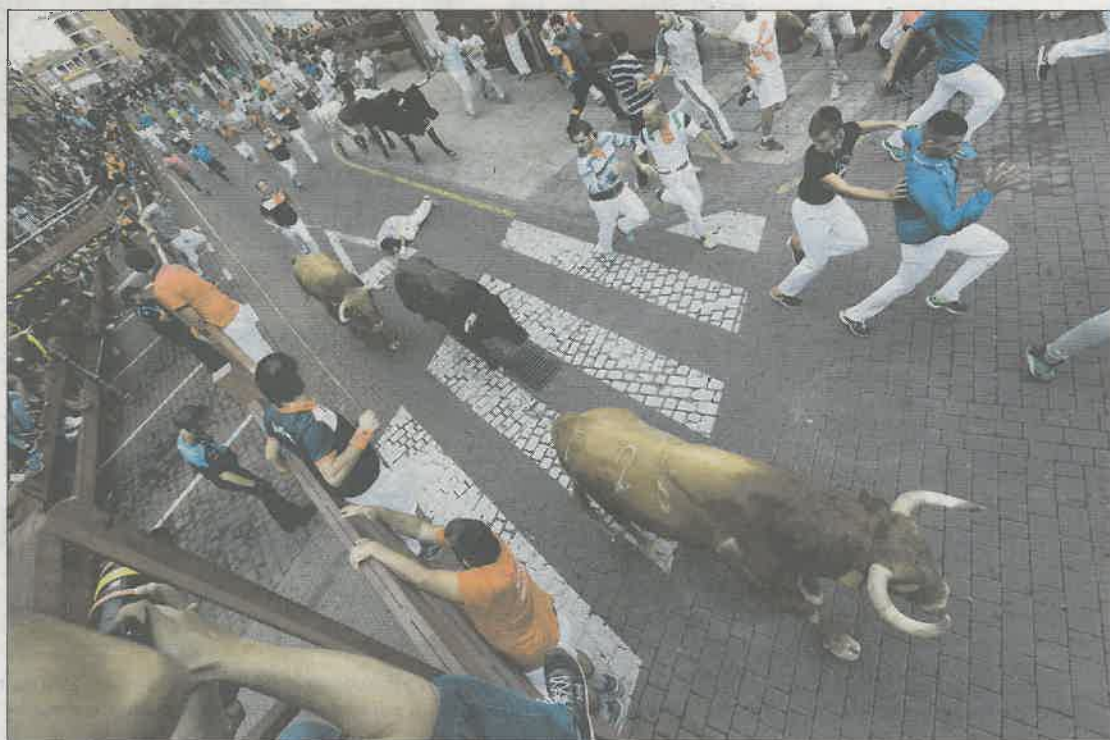
Segundo encierro de las fiestas de San Sebastián de los Reyes.

El herido, que fue trasladado al hospital Infanta Sofía, sufrió una luxación que fue examinada en el hospital de campaña, donde los médicos consideraron en una primera valoración que se le debían realizar pruebas radiológicas para descartar una fractura de muñeca.