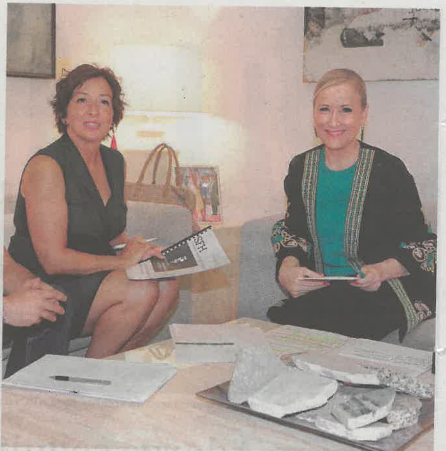
La presidenta Cifuentes con la alcaldesa de San Fernando de Henares ABC

La línea 7B, que abrió en 2007, tiene un largo historial de obras a sus espaldas. De hecho, estuvo cerrada casi un año entero entre las estaciones de