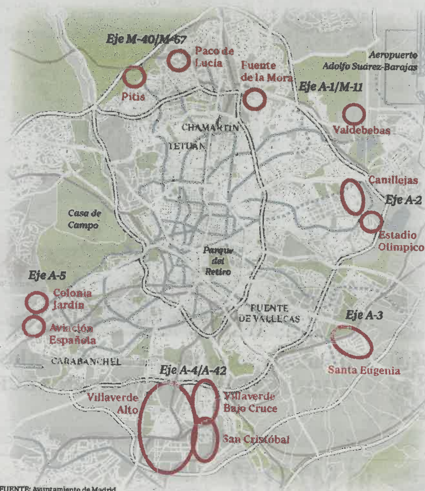
Ubicación de los proyectos

Una de las medidas del Plan A de Calidad de Aire, elaborado para combatir los altos niveles de polución en la ciudad, prevé construir hasta doce aparcamientos disuasorios en ocho