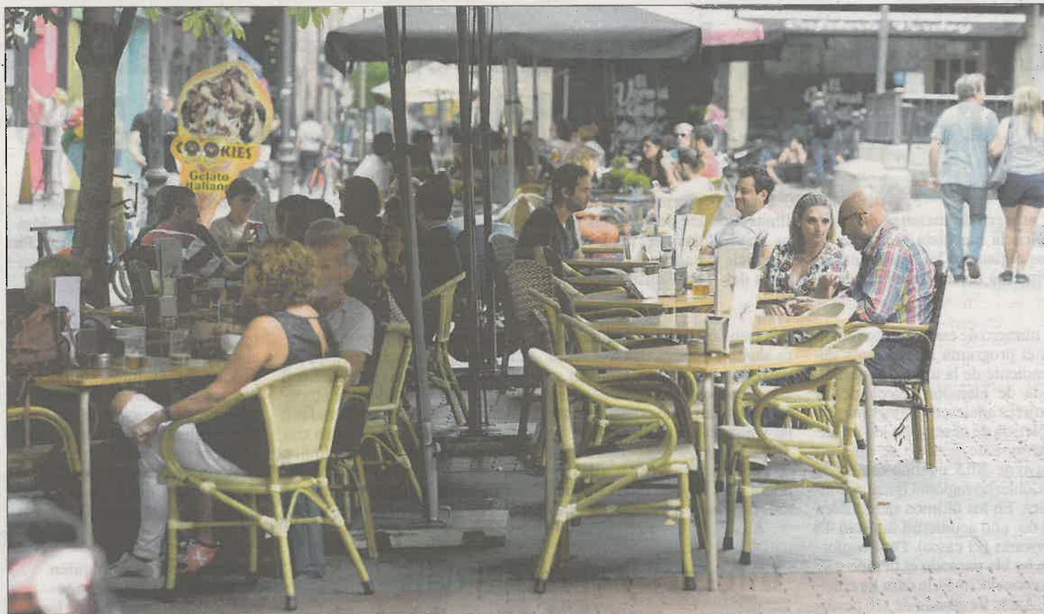
Mesas de una terraza ayer en la plaza de Chueca.

"La gestión de las terrazas con el Ayuntamiento de Ahora Madrid sigue siendo un fabuloso desastre. Directamente no se gestiona", resume el portavoz.