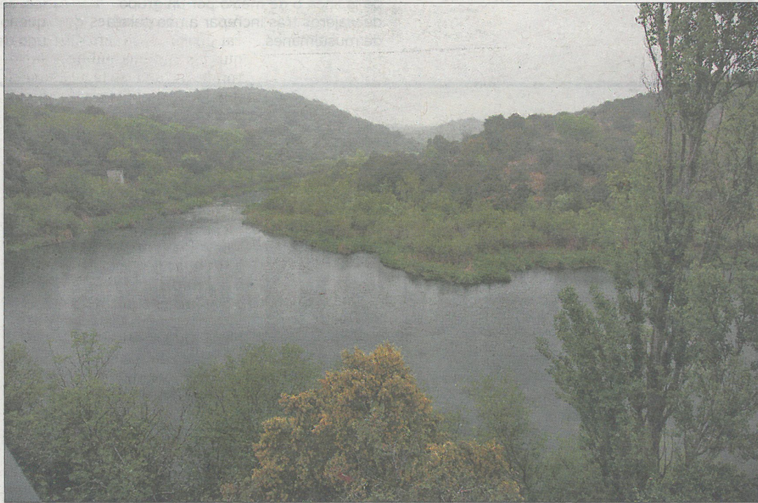
Aspecto que presentaba la presa del río Aulencia el pasado mes de abril.

La regidora defendió, no obstante, que un colectivo madrileño celebre el próximo día 17 en una sala municipal un evento en apoyo al referéndum separatista. “El Ayuntamiento no organiza nada, solo cede un espacio a una asociación”, se justificó. Su decisión ha provocado críticas de otros grupos municipales. PSOE y Ciudadanos le piden “más firmeza” ante el desafío soberanista, mientras que el PP interpondrá un recurso contencioso para evitar la cesión del local. Ayer, las tapias de Matadero aparecieron con pintadas falangistas en contra del acto.