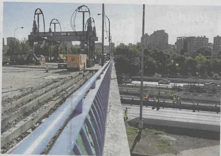
Obras para levantar el puente de la avenida del Mediterráneo

Tras finalizar el levantamiento de la parte superior, los apoyos de la plataforma o, lo que es lo mismo, la base del puente, quedarán al descubierto para poder proceder a su reparación, ya que, según el Ayuntamiento, se encuentran