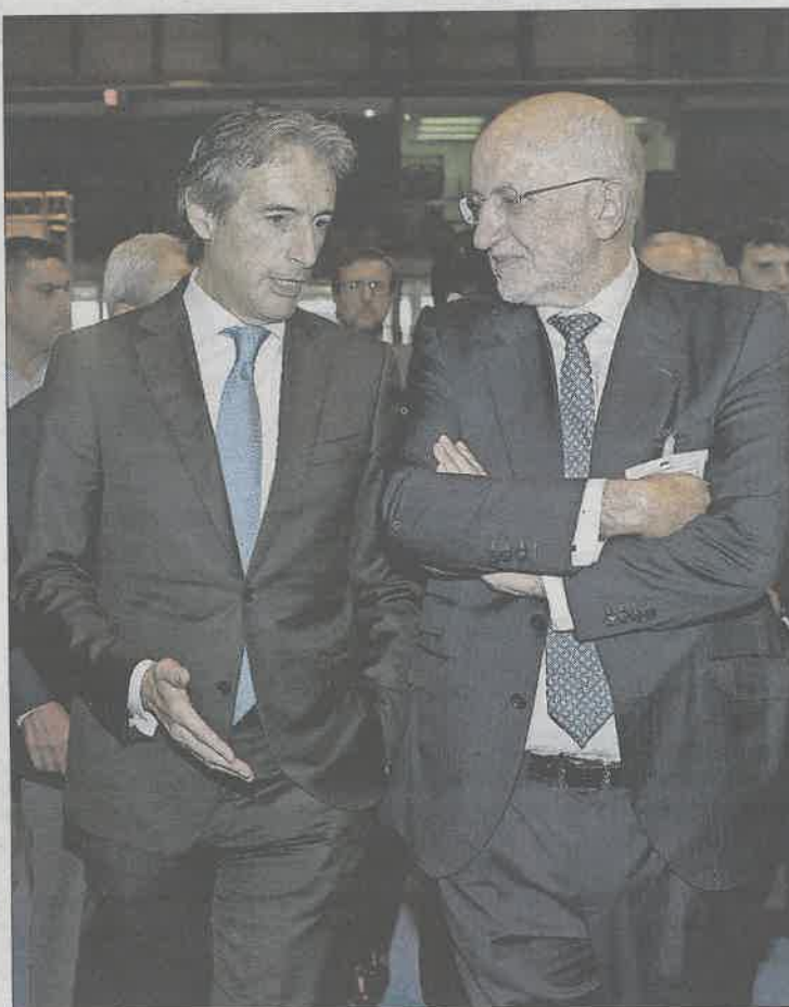
El ministro De la Serna (izquierda) y Juan Roig, ayer en Madrid.

"Para el Gobierno es un proyecto de clarísimo interés estratégico. Tenemos sobradas razones para querer el Corredor, porque es necesario para nuestro país. De entre todas las infraestructuras que tenemos en planificación, esta sin lugar a dudas es la más importante, es la gran infraestructura que servirá de motor en nuestro país en las próximas décadas", aseguró el ministro.