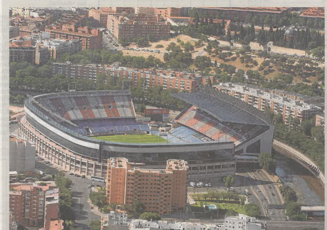
Estadio Vicente Calderón, en la ribera del Manzanares, ya sin uso desde el inicio de esta temporada

La de la Operación Mahou-Calderón es una larguísima historia de batacazos judiciales, que comenzó cuando la iniciativa fue aprobada por el Ayuntamiento -en noviembre de 2009- y un mes más tarde por el Gobierno regional -que entonces presidía Esperanza Aguirre-. Entonces comenzó un rosario de recursos y fallos judiciales que llevaron a la anulación de la modificación del plan en 2015 y a la paralización cautelar de la operación en ese