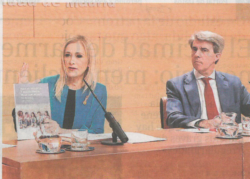
La presidenta Cifuentes y el consejero y portavoz Garrido, ayer

En el escenario 1 se pondrán en marcha por parte de la Comunidad avisos a la población a través de redes sociales y medios de comunicación. En el escenario 2, se establecen mensajes directos a mayores, niños, embarazadas, deportistas... Y se limi-