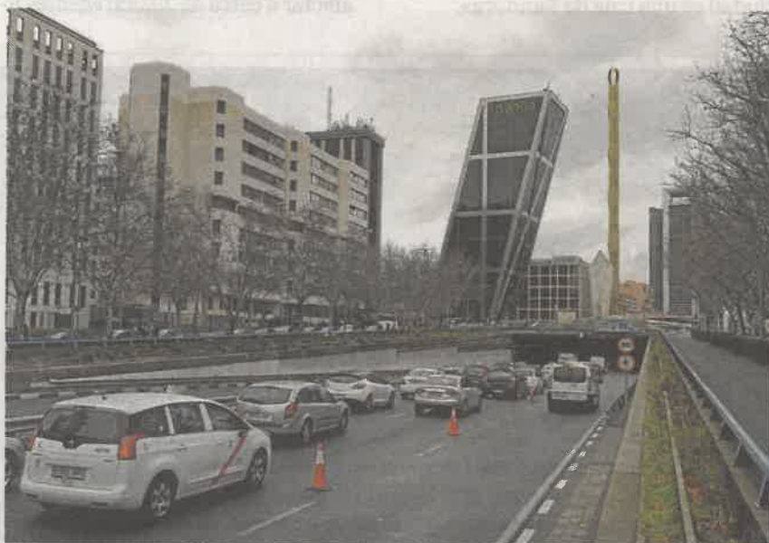
Estado de la Castellana, ayer, por los cortes en el túnel de Plaza de Castilla