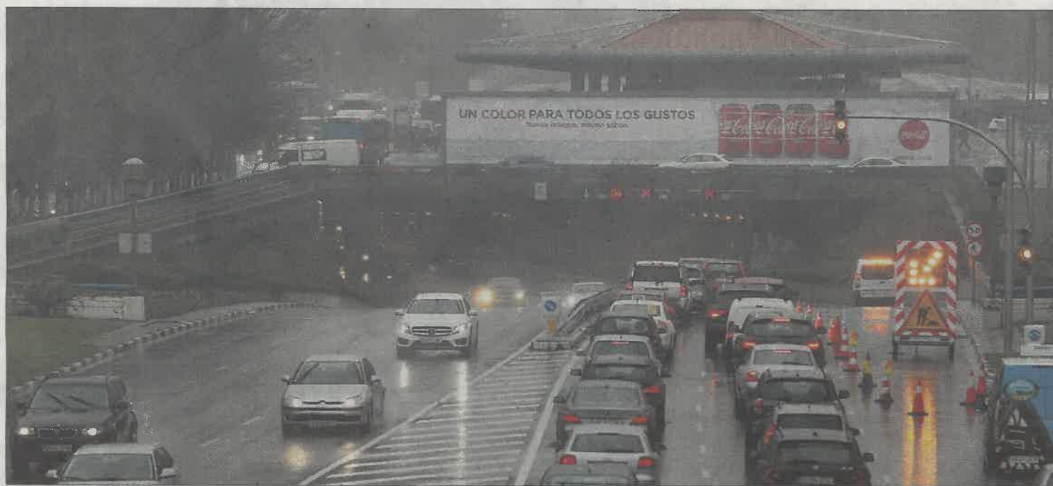
El túnel de la plaza de Castilla fue cortado ayer al tráfico en un sentido por las filtraciones de agua.