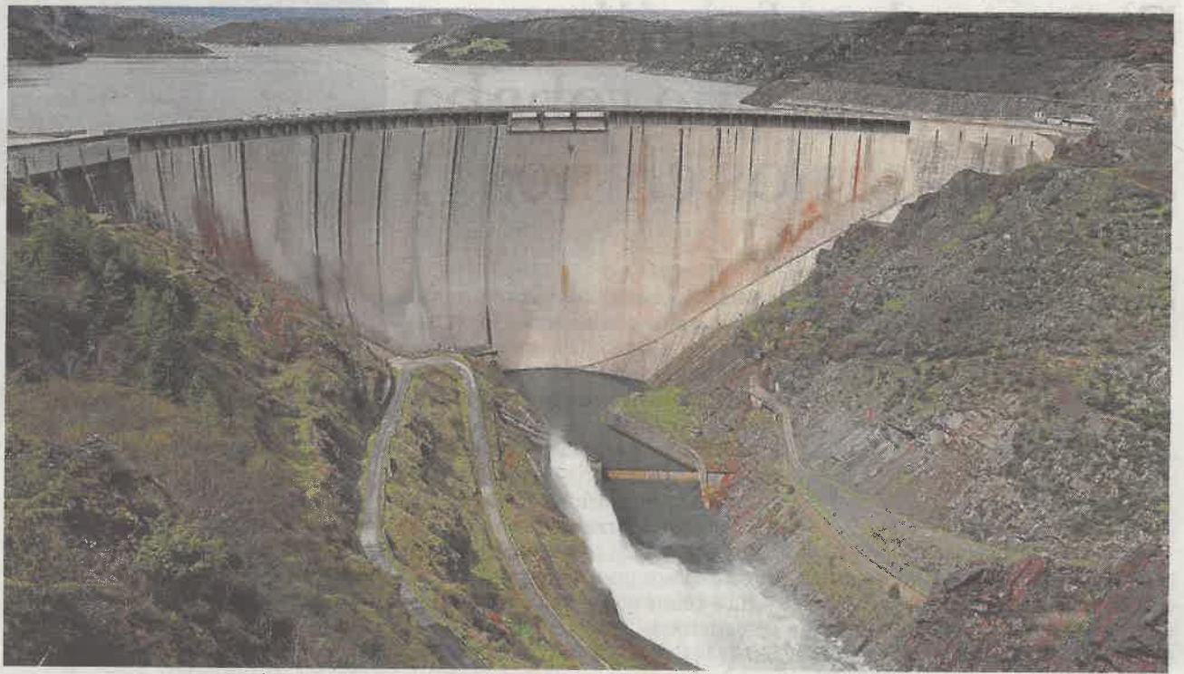
Imagen del embalse del Atazar, el de mayor capacidad en la Comunidad de Madrid

En Madrid, a 26 de Febrero de 2018. El Secretario del Consejo de Administración.