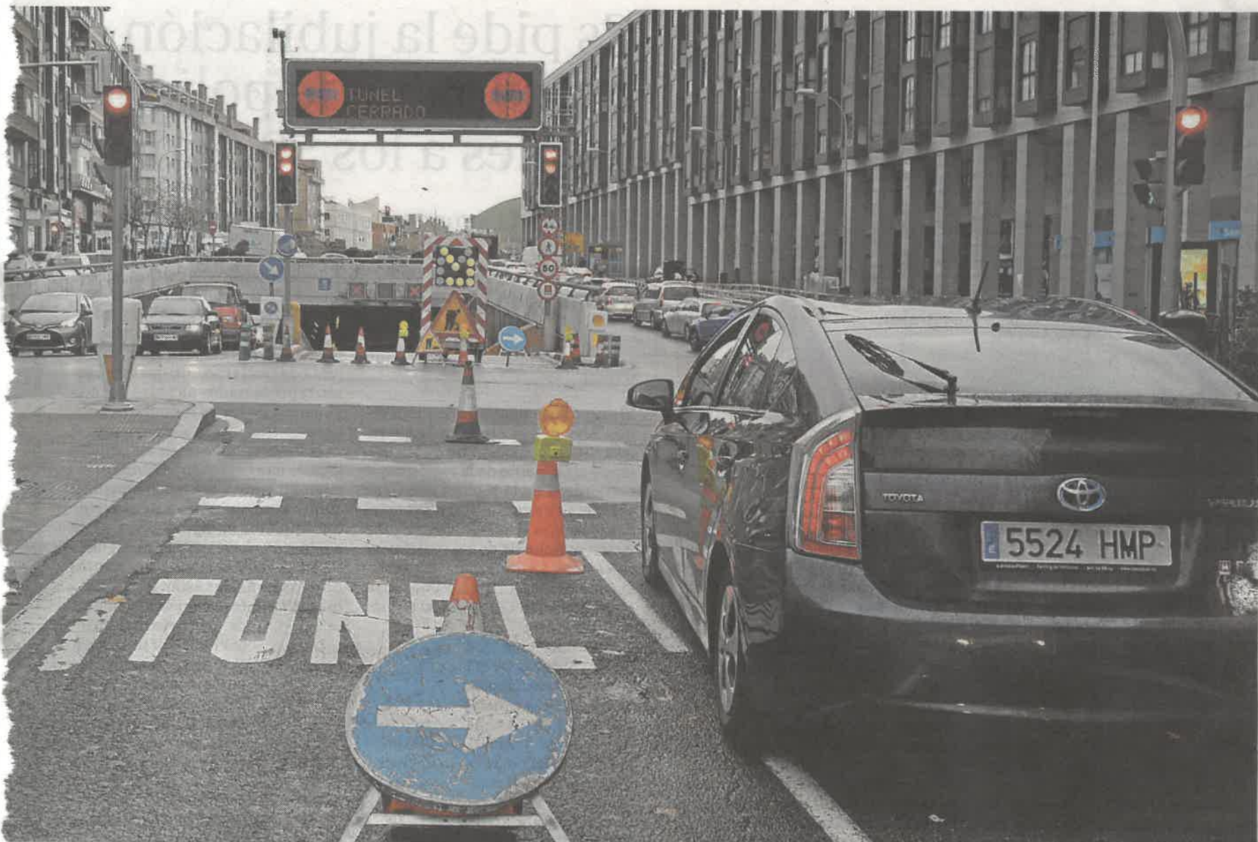
El túnel de Sor Ángela se cerró por completo ayer con dirección a la calle de Villaamil