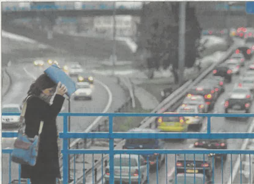
Atasco en el nudo de Manoteras bajo la lluvia. ROBERTO CÁRDENAS

Para el portavoz del sindicato de clase mayoritario, «el problema es que Metro conoce que hay amianto desde hace 15 años y todavía hoy sigue sin elaborar un plan para eliminarlo». Además, denuncia que a pesar de que se ha informado de la realización de chequeos médicos a 413 trabajadores actualmente en plantilla (de los cuales se han hecho ya 342 y el resultado ha