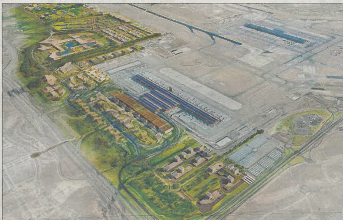
Recreación del plan urbanístico para el Aeropuerto de Madrid-Barajas.

Gabilondo comparó a Ciudadanos y al PP con los jugadores del juego del pañuelo, donde "uno no sabía si era mejor coger pañuelo y correr mucho o esperar que lo coja otro y seguirlo". El portavoz llevó a la rueda de prensa el documento que han elaborado ante la moción de censura, denominado Programa político para el Gobierno de la Comunidad de Madrid , pero declinó enseñarlo a los medios de comunicación.