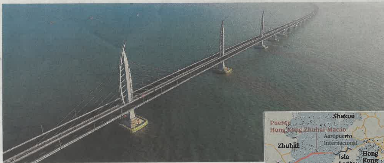
Así es el nuevo prodigio de la ingeniería china

Con un coste de 12.000 millones de euros, ya es el puente más largo del mundo sobre agua. Une Hong Kong y Macao en el estuario del río de las Perlas