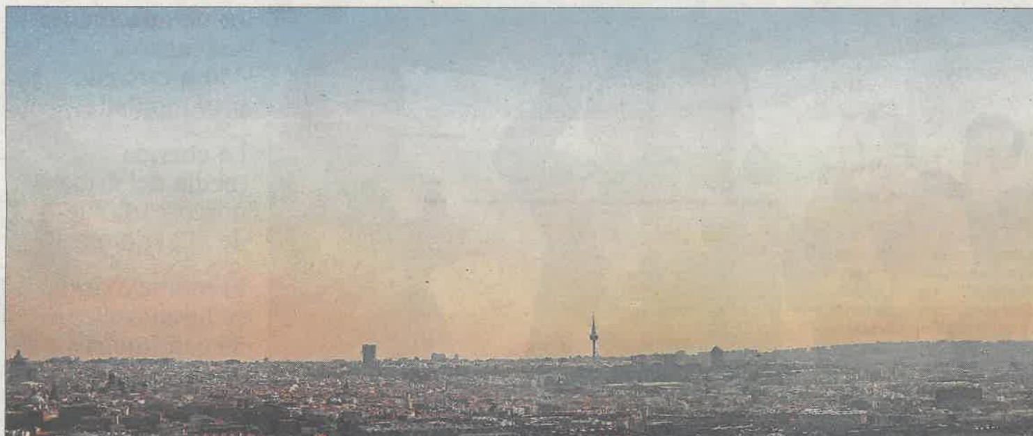
Vista de la contaminación en el cielo de Madrid, ayer.