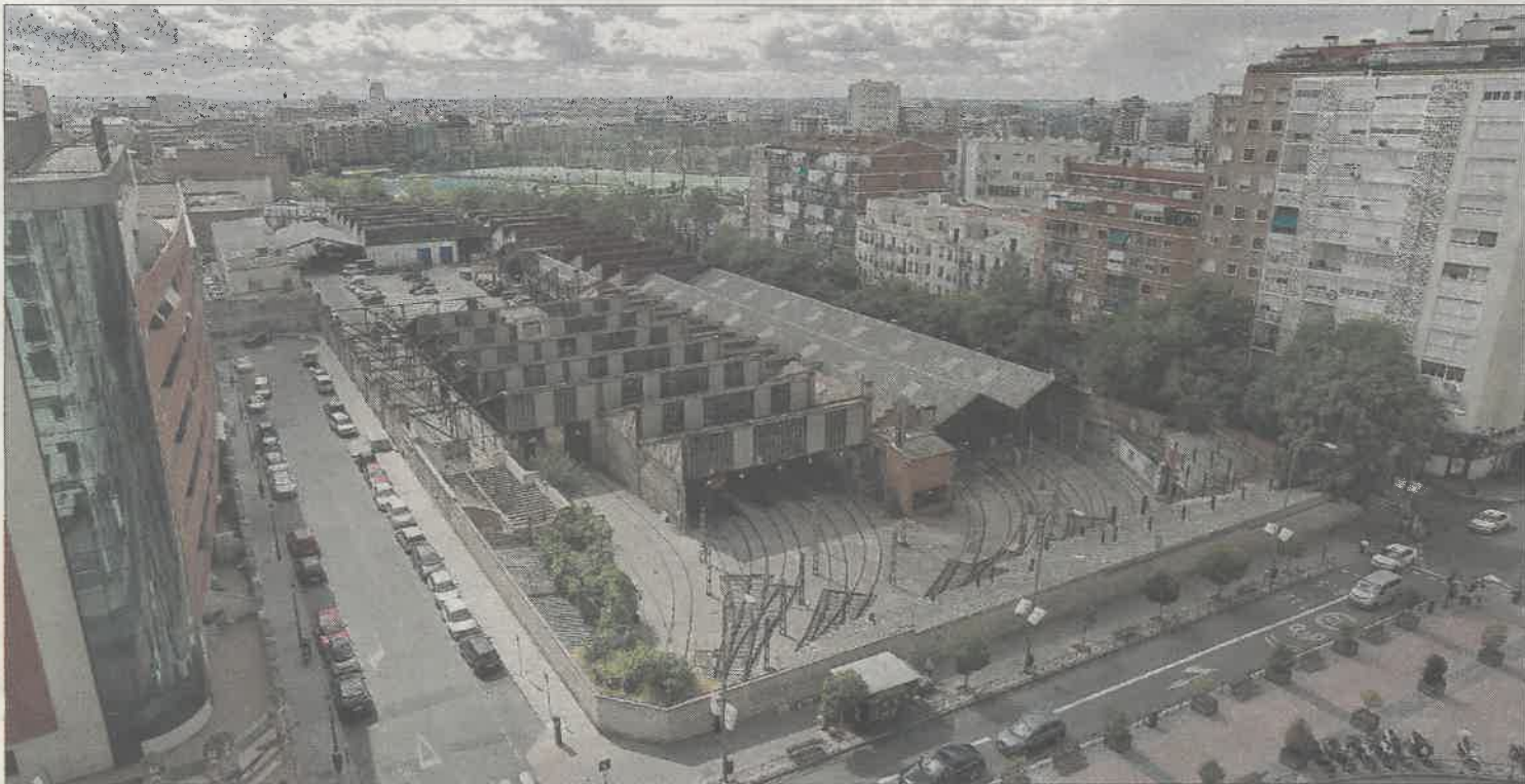
Vista aérea de las cocheras de Cuatro Caminos.