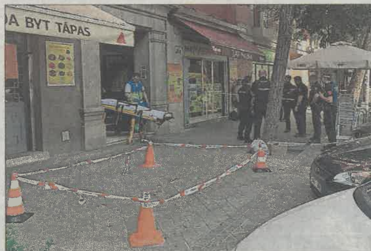
Un sanitario sale del edificio donde se produjo el crimen.

El otro herido, de 54 años y supuesto autor de la muerte de su hermano, presentaba una herida también en el hemitórax izquierdo y otra en el cuello. Tras ser estabilizado, fue trasladado