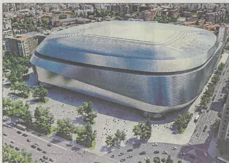
Simulación del proyecto acabado de reforma del Bernabéu.