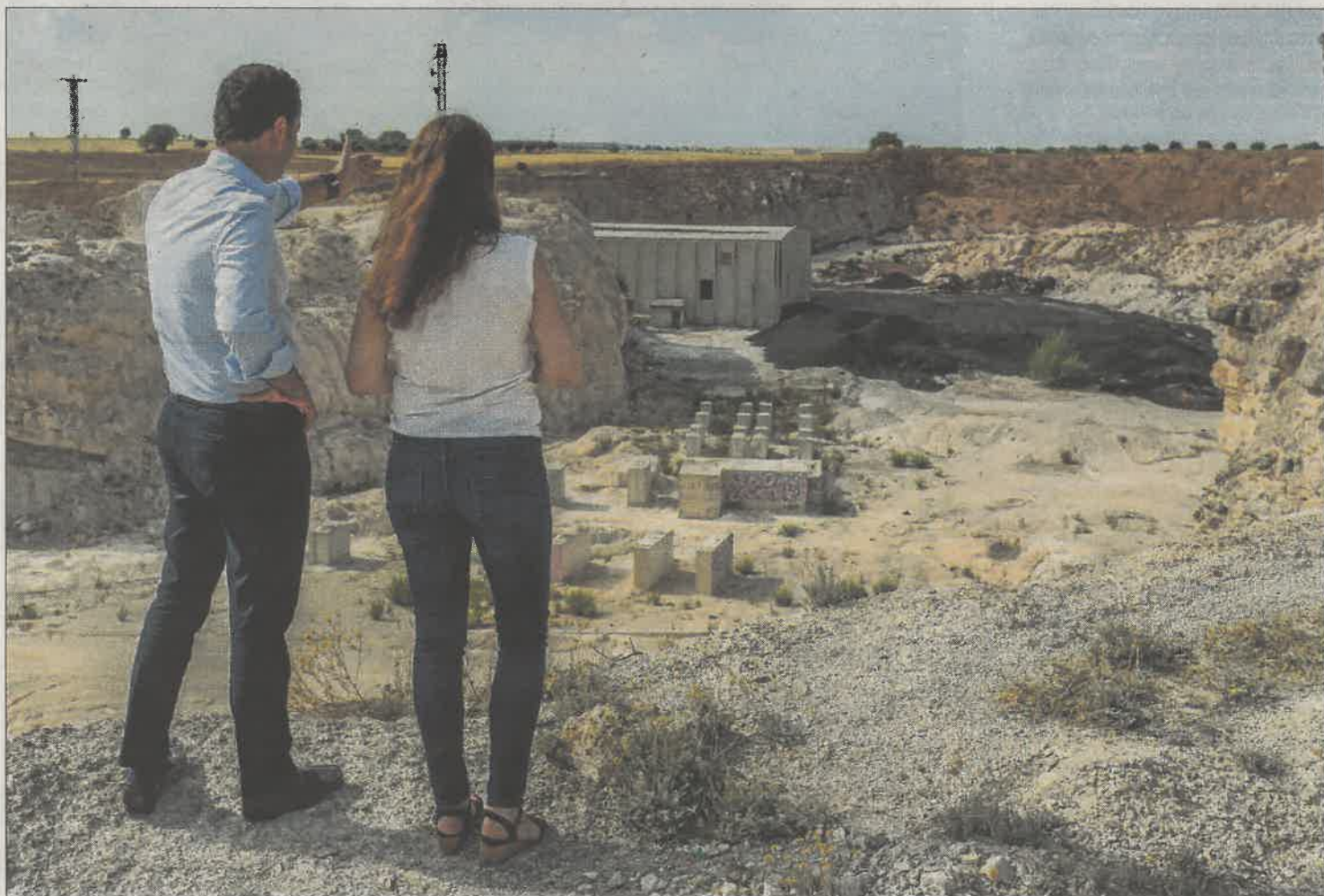
Vecinos de Campo Real observan la acumulación de lodos en una finca situada a pocos kilómetros del casco urbano. SERGIO ENRÍQUEZ NISTAL

Hasta principios de siglo, el tratamiento de los lodos se hacía al aire