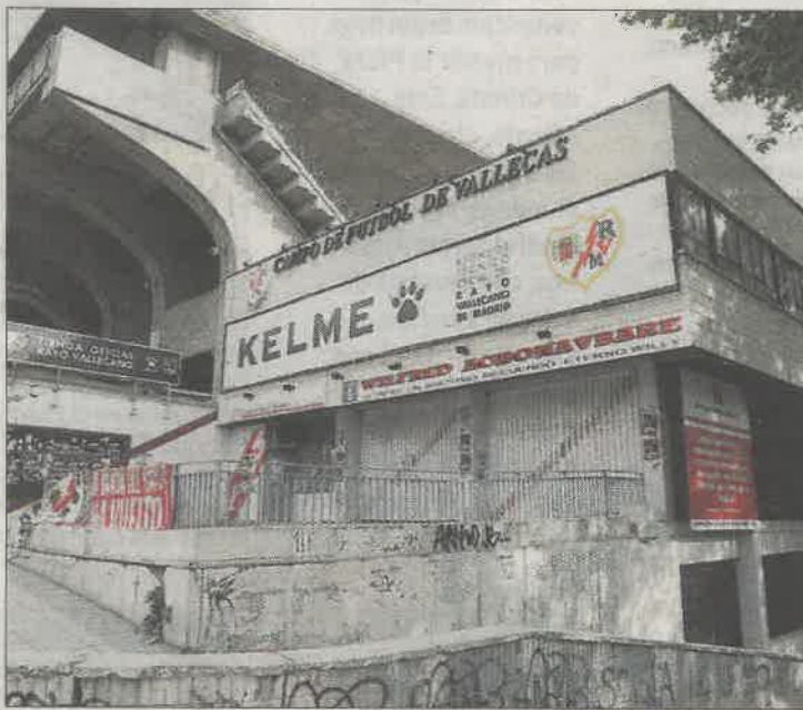
El estadio del Rayo Vallecano.

Según la Comunidad, la dirección de las obras ha emitido un informe técnico indicando que no