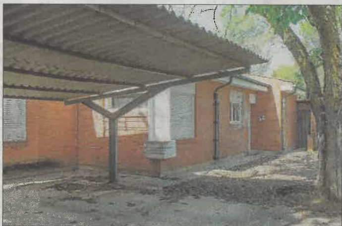
Una casa de ingenieros abandonada junto a la central. ÁNGEL NAVARRETE

En la década transcurrida desde la caída de Lehman Brothers y muy lejos de Wall Street, un total de 283 sociedades energéticas han solicitado el concurso de acreedores lastradas por el impacto de la reforma eléctrica. «Muchas otras han sobrevivido vendiéndose a fondos buitres con quitas en los precios del 50%. La parte social está hoy excluida del sector en favor, se nos ha estigmatizado», concluye Martínez.