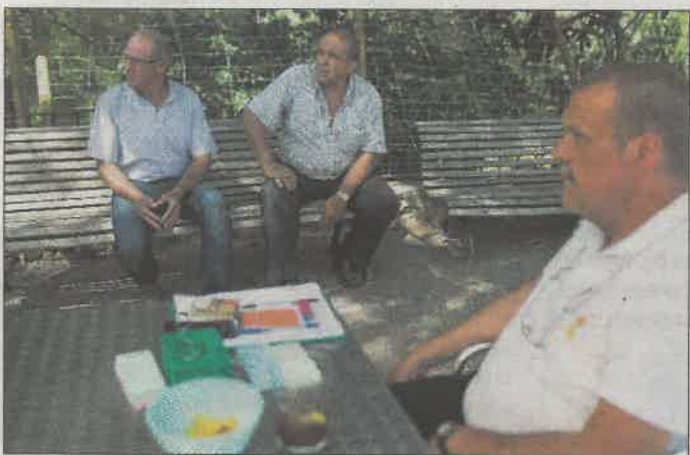
Varios jubilados conversan sobre sus años de trabajo en la instalación. A. N.