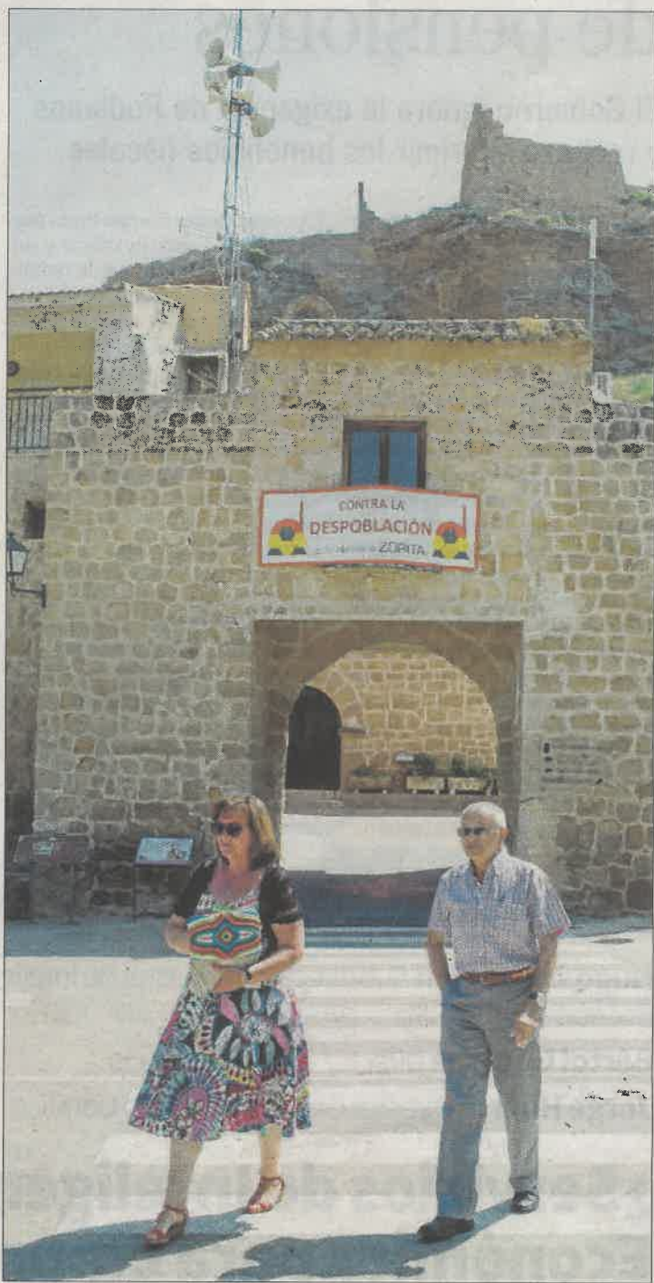
Vecinos de Zorita de los Canes pasean frente al cartel contra la despoblación. A.N.

El epicentro del plan pasa por la creación de los denominados «contratos de transición». Se trata de una figura nueva en España pero extendida ya por otros países europeos como Francia o Reino Unido. A falta de concretarse los detalles, este mecanismo garantiza la financiación pública de distintas medidas de transición en las zonas afectadas pero llevará aparejado una fuerte supervisión en términos de empleo y reducción de emisiones para evitar que se vuelva a producir despilfarro de dinero público: el