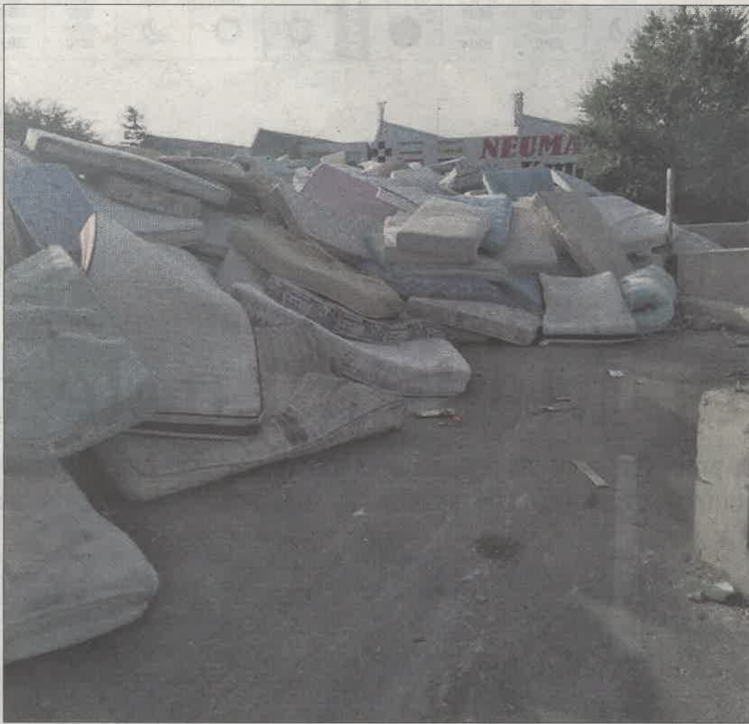
Los cientos de colchones que abarrotan uno de los dos puntos limpios del municipio de Alcorcón.