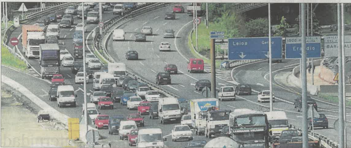
Coches, en un atasco en el intercambiador de Cruces, en la localidad vizcaína de Baracaldo.