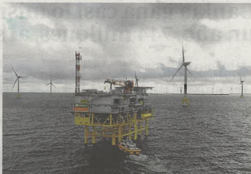
El parque eólico marino Wikinger cuenta con 70 aerogeneradores

Wikinger ha supuesto una inversión de 1.400 millones de euros y un auténtico desafío a nivel de ingeniería y desarrollo de proyecto. La obra ha supuesto hincar al lecho marino 280 pilotes, de 40 metros de longitud y 2,5 metros de diámetro, con un peso