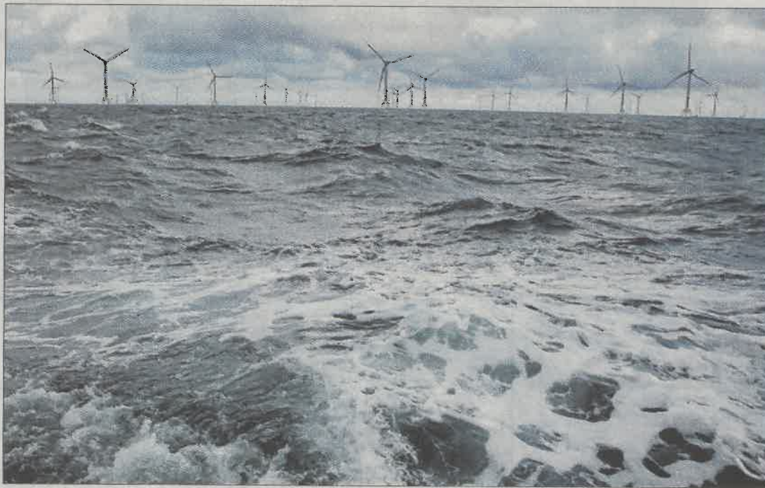
El parque eólico marino Wikinger que ayer inauguró Iberdrola en Sassnitz, Alemania. E. M.

«Nuestro compromiso con la energía limpia es irrenunciable.