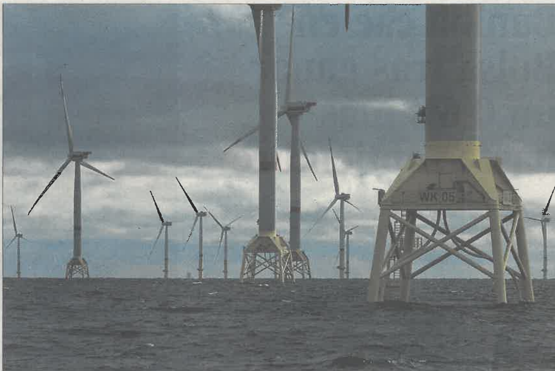
Aerogeneradores del parque eólico marino de Wikinger (Alemania), sobre el mar Báltico.

Según el estudio, en España solo el 18% de las autovías y autopistas es de pago, y en el actual contexto de reducción del déficit ve complicado que el Estado asuma la inversión necesaria para construir y mantener carreteras solo con fondos públicos. El informe va contra la línea del Ministerio de Fomento, que ha anunciado que liberará de peajes las concesiones que vencen entre 2018 y 2021.