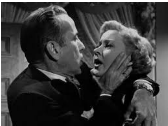
Bogart y Grahame, en una escena del film

Otro momento memorable es cuando Bogart llama al productor de la película “vendedor de palomitas” porque todas sus películas son iguales, y éste le replica que sí, que lo es, pero que él, al menos, lo reconoce. Esa pequeña frase nos dice mucho del personaje principal, el cual sabe que en anteriores etapas de su vida como guionista se ha vendido, realizando malos guiones que sabía que tendrían éxito y eso le reconcome porque sabe que con su talento puede crear cosas realmente buenas. Esta también es una de las causas de su resentimiento con la industria, a la cual no tiene ningún problema en atacar verbalmente a la mínima ocasión. Todo lo que aparece en la película tiene varios sentidos, empezando por el título de la cinta. “ En un lugar solitario ” se refiere al lugar donde en teoría se comete el asesinato (así lo menciona Bogart en una escena en casa de su amigo Brub, el policía), y también puede hacer referencia al sitio donde escribía Dix antes de conocer a Laurel. Así, una historia aparentemente sencilla, es en realidad un análisis de las diferentes personalidades dentro del microcosmos que es Hollywood en los años 50, recreándose especialmente en la personalidad “especial” de Steele y la crispación a la que se ve sometido al ser acusado del crimen.