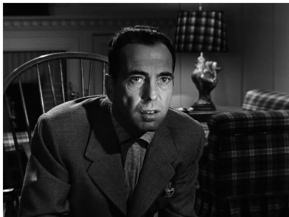
Bogart con iluminación forzada en casa de Brub.

El pesimismo de la película resulta estimulante gracias a la oscuridad visual de Ray y a una tendencia poética casi surrealista, como la iluminación forzada en la cara de Bogart cuando está reconstruyendo el escenario del crimen en casa de Brub y Silvy y al final de la cinta. La adaptación de la novela de Hughes resulta muy reveladora: la mayor diferencia entre el libro y la película es que en ésta, Dixon Steele, aunque violento, solo es acusado de asesinato, mientras que en el libro, es un asesino en serie y un violador. Ray afirmó que hizo el cambio porque estaba “más interesado en hacer una película sobre la violencia en todos nosotros, en lugar de una película de asesinato en masa, o una sobre un psicótico”. Hughes nunca se molestó por los cambios de su novela y elogió la actuación de Gloria Grahame.