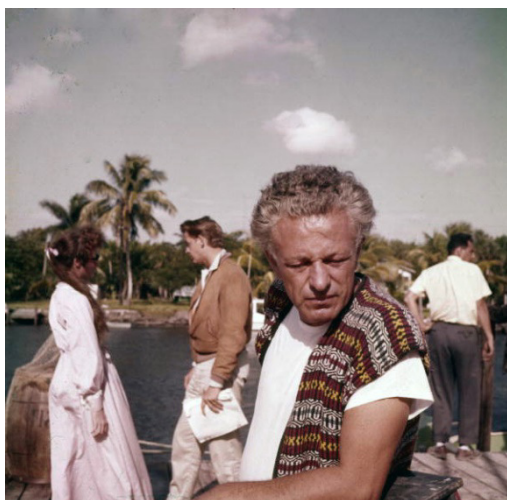
Nicholas Ray en el escenario de "Muerte en los pantanos"

También entra en contacto, a través de ese grupo de teatro, con John Houseman, actor y productor de cine estadounidense, quien le animó a iniciar su carrera como director.