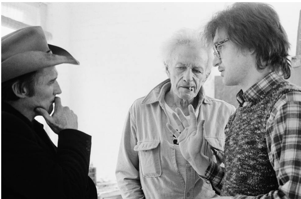
Con Wim Wenders (derecha) y Dennis Hopper en el rodaje de El amigo americano .

En 1977 interpreta el personaje de un pintor en El amigo americano , del alemán Wim Wenders, y también intervino brevemente en la versión del musical Hair .