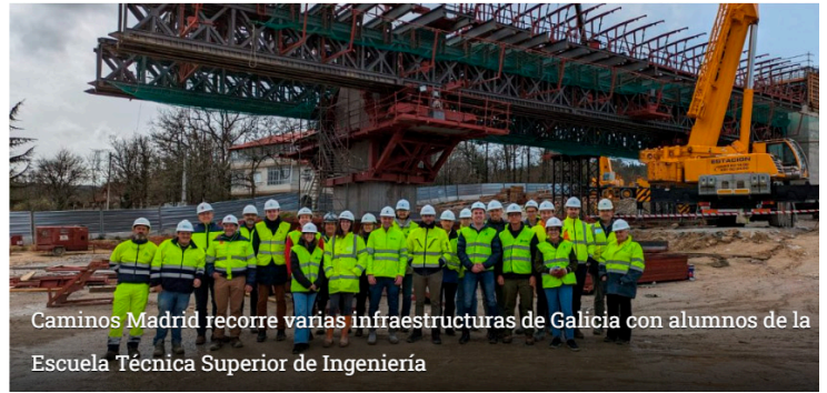
Caminos Madrid recorre varias infraestructuras de Galicia con alumnos de la Escuela Técnica Superior de Ingeniería

Coste 32€ Pago con cargo en cuenta de cuotas una vez confirmada la inscripción.